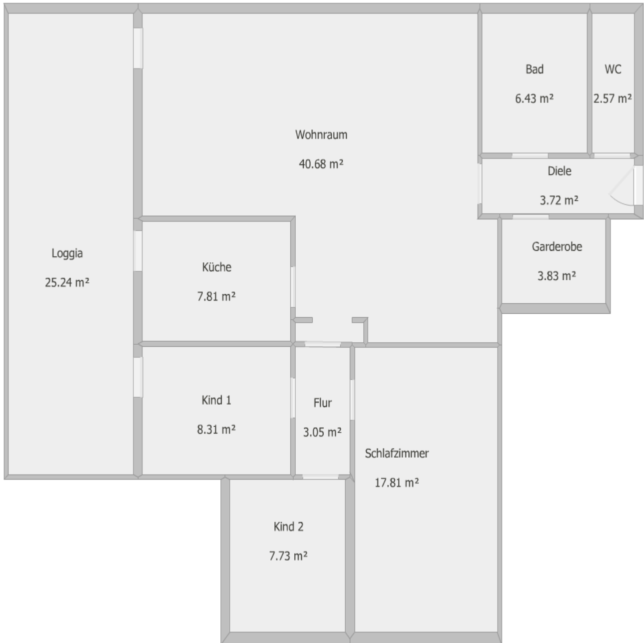
Grundriss Whg. 3