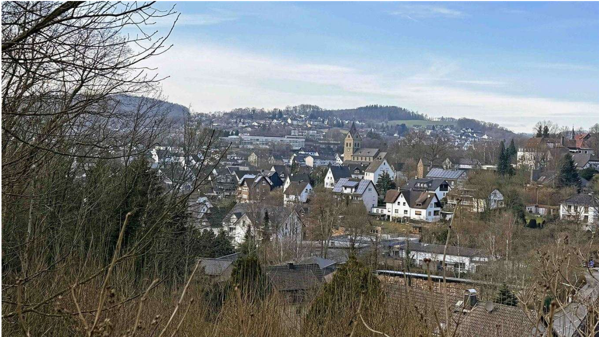
Blick zum Morsbacher Zentrum (ca. 400 m)