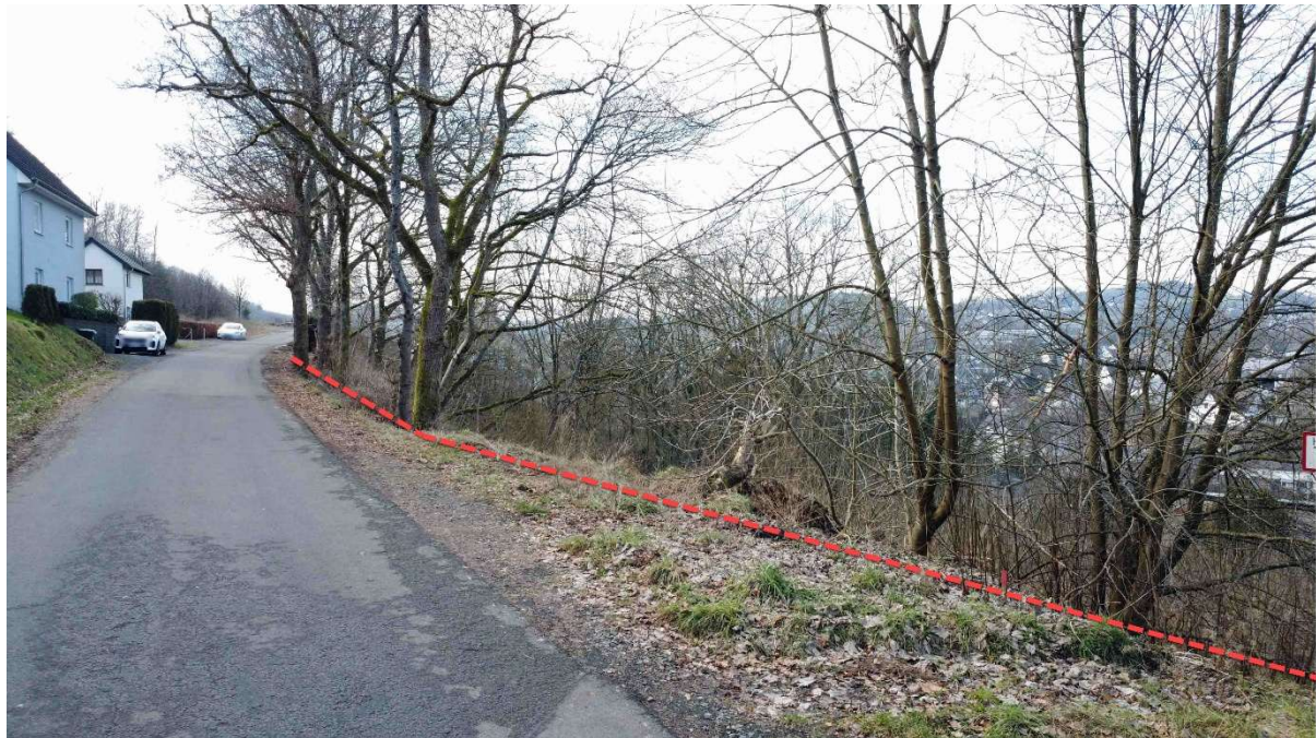
"Auf dem Alzerberg": Straßenblick von oben