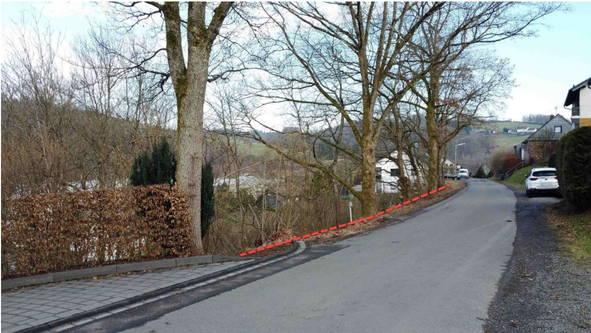
"Auf dem Alzerberg": Blick nach Osten