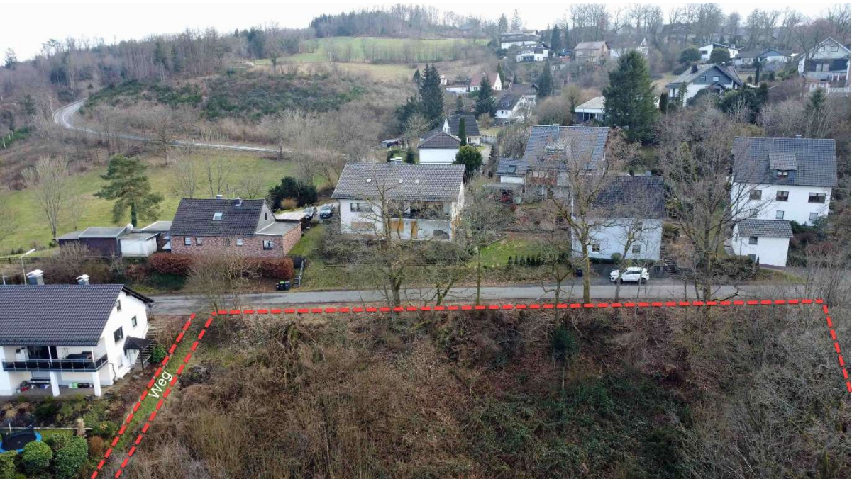
Herrliche Lage, aber "Auf dem Alzerberg"