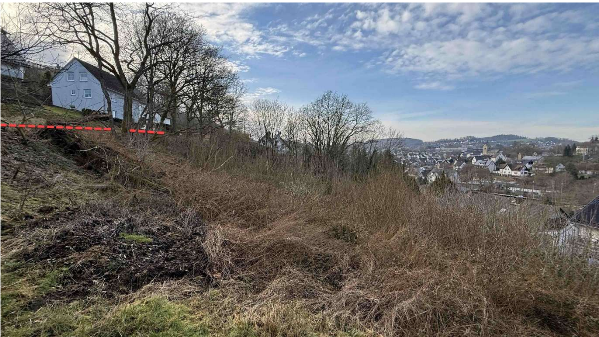
das Grundstück ist sehr steil