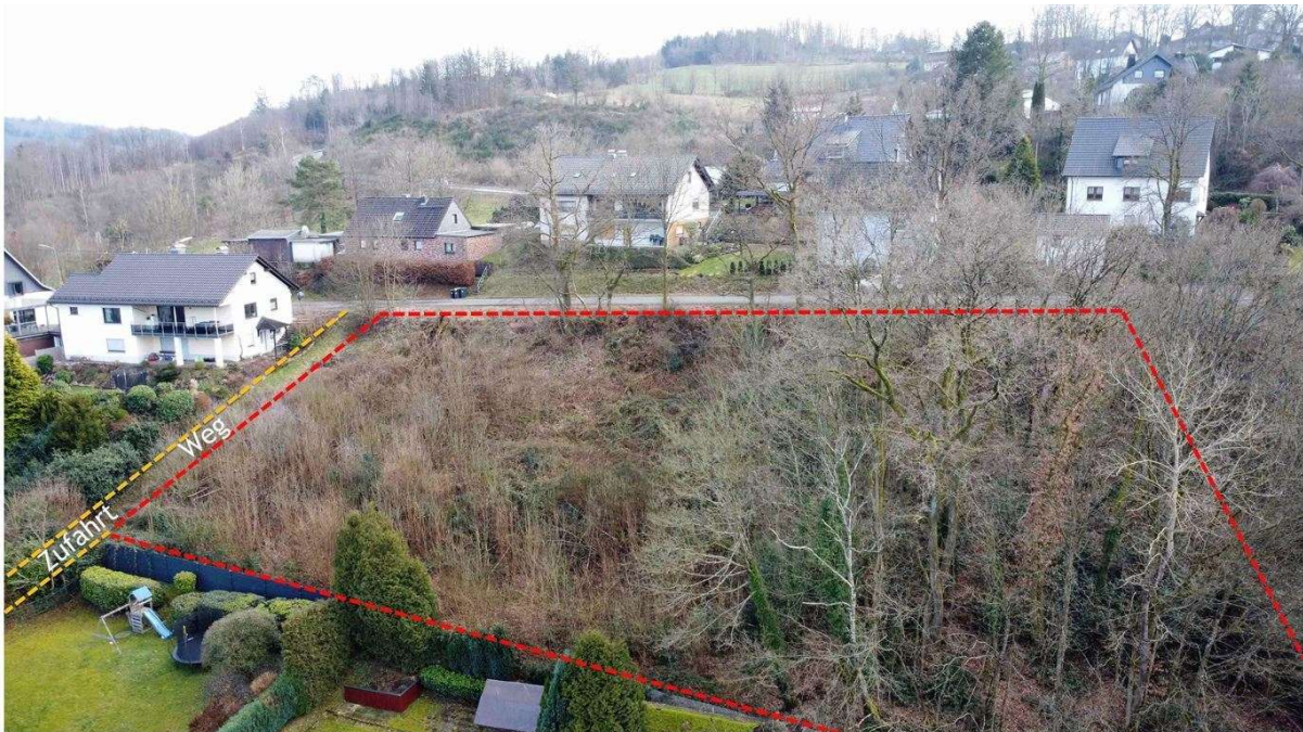
Oben im Bild die Straße 'Auf dem Alzerberg'