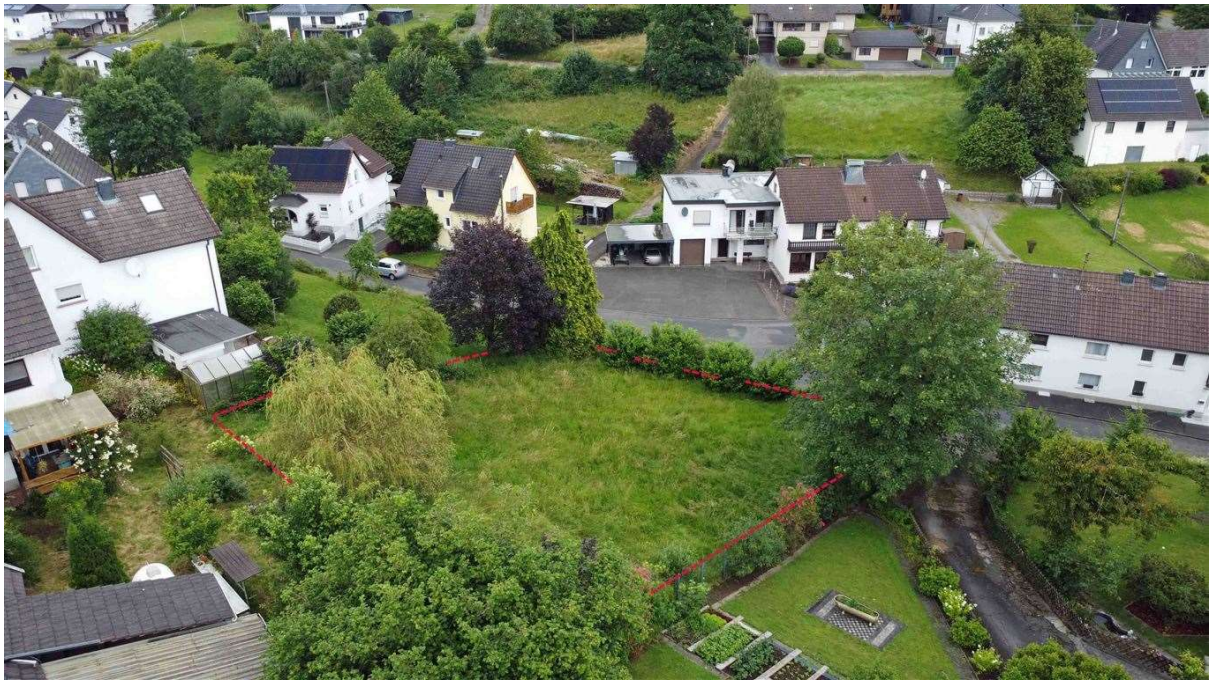
zentral, aber ruhig und grün in Alzen gelegen