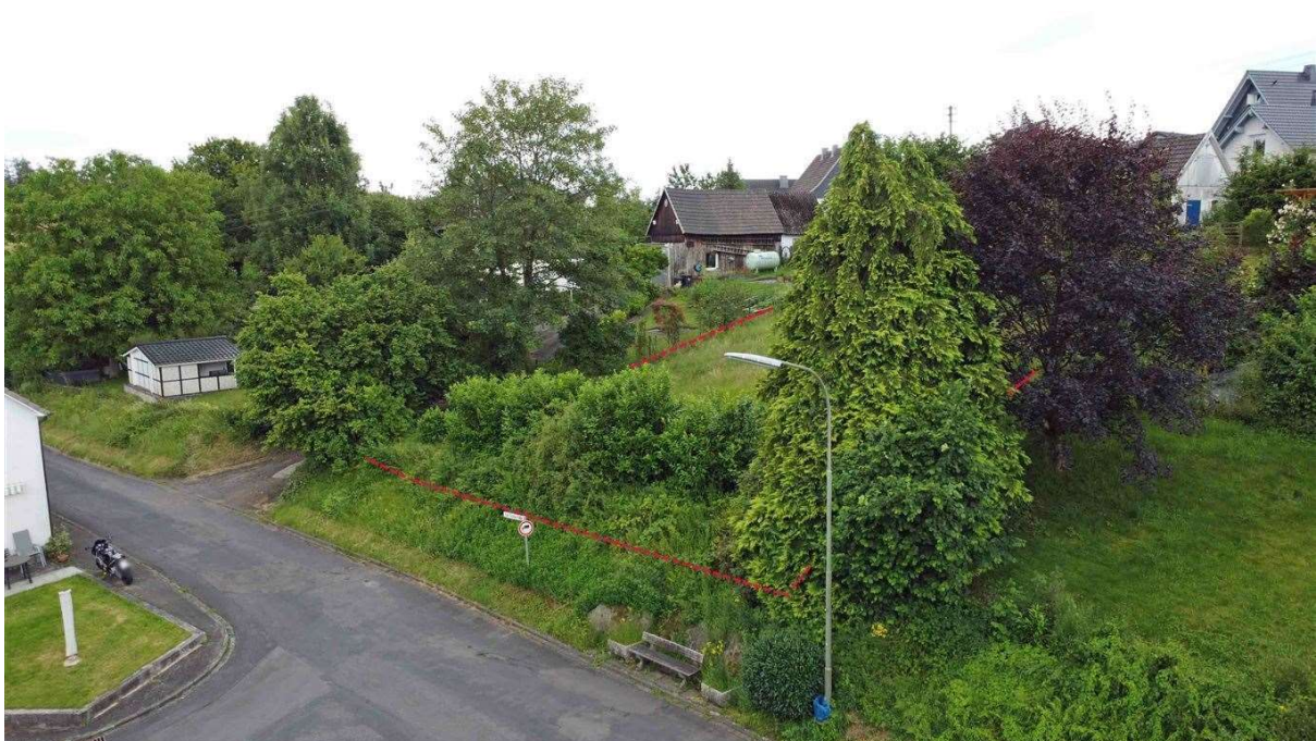
ruhige Lage in Alzen