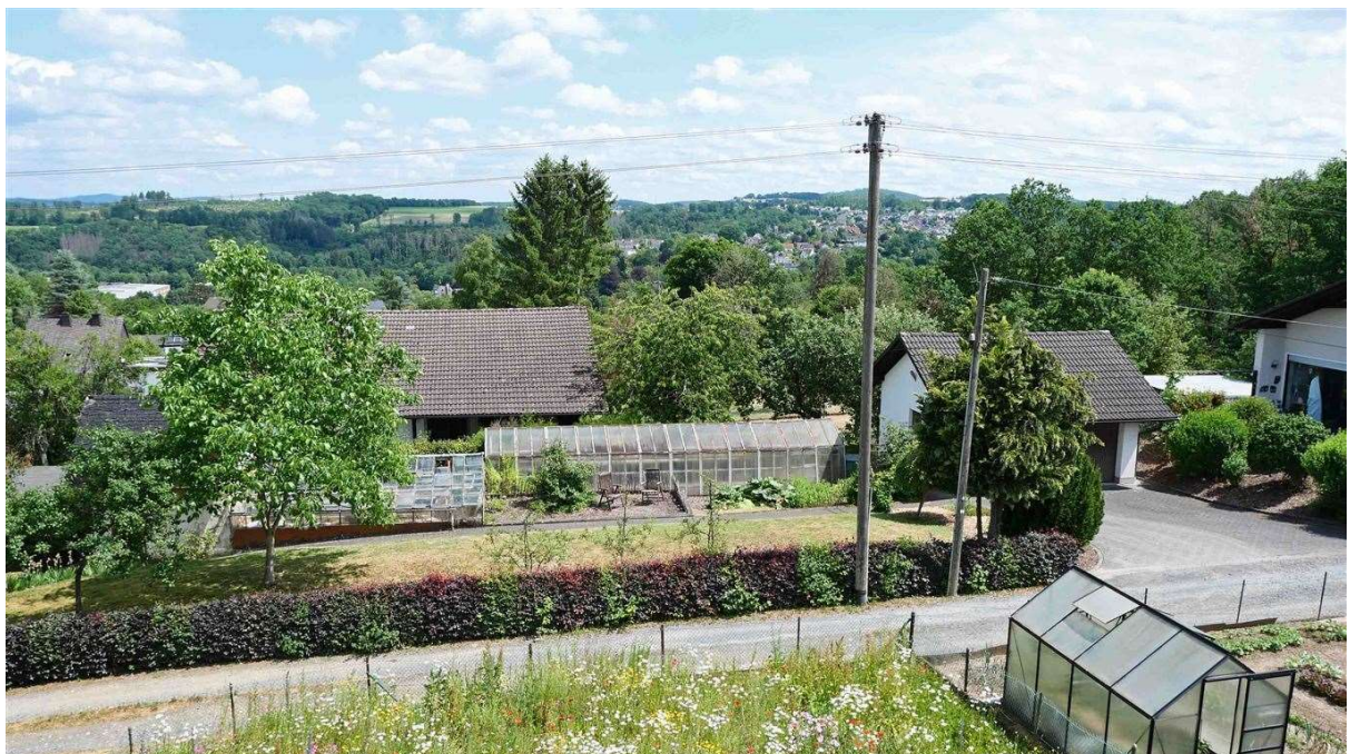
Fernblick auf Wissen-Schönstein