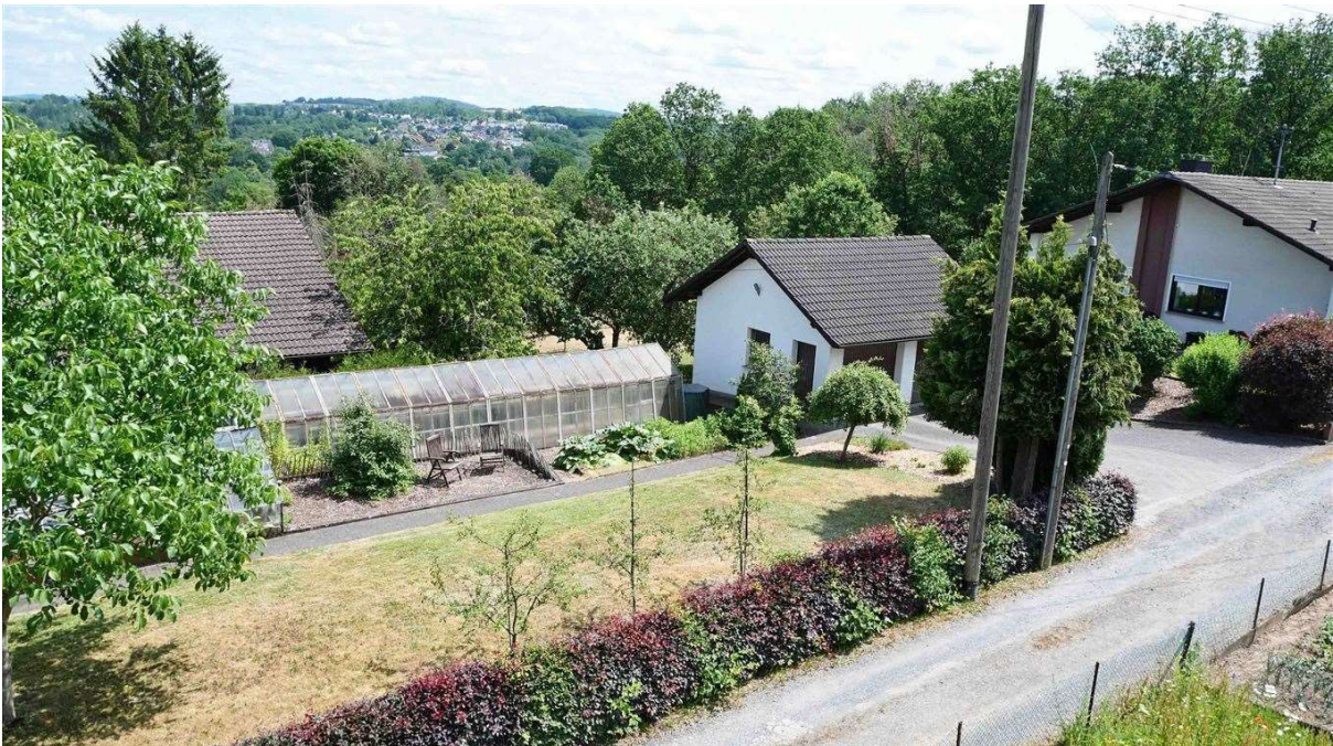
Blick zum Osten