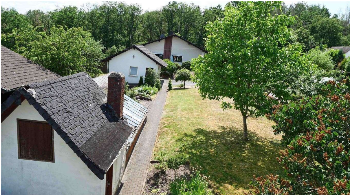
Blick zum Süden