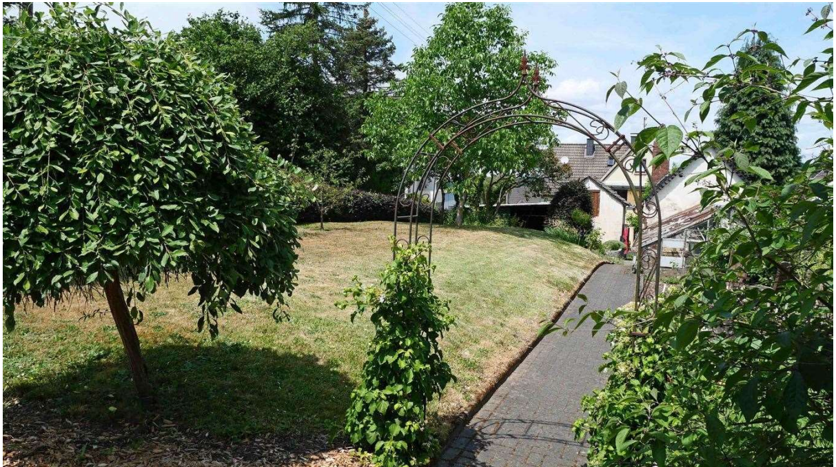
immer noch ein schöner Garten