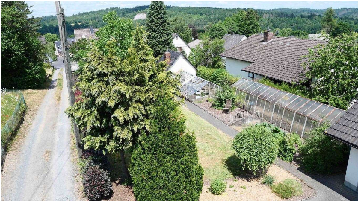
Gartenbeete und zwei Gewächshäuser vorhanden