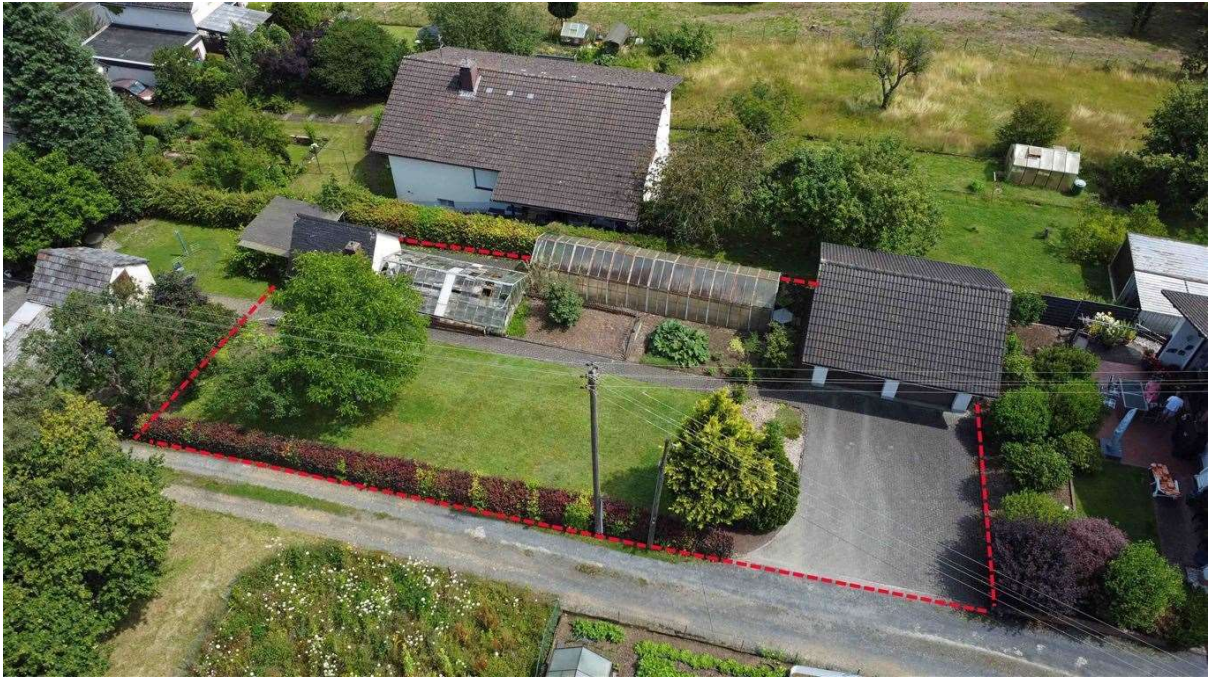
Blick von Westen nach Osten