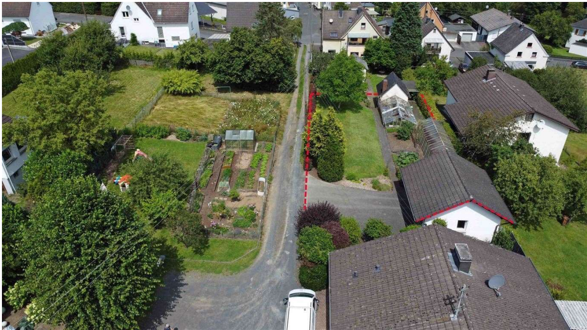
herrlich von vielen Gärten umgeben