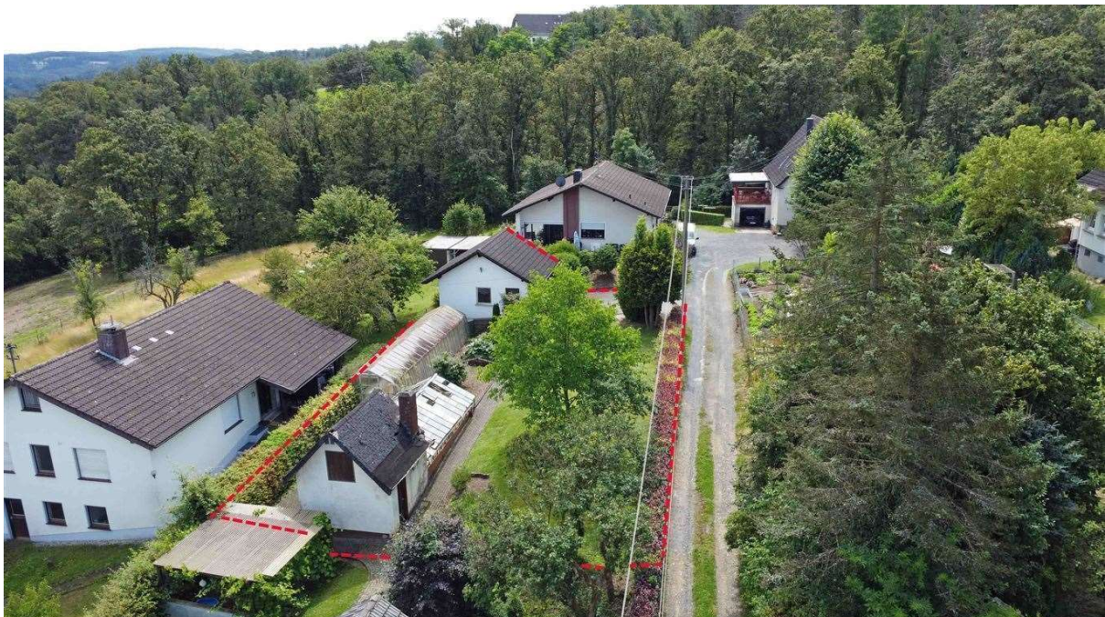
absolut ruhig am Wald und Sackgasse gelegen