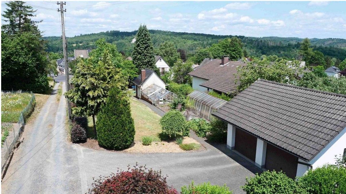
586 m 2 Baugrundstück mit Doppelgarage