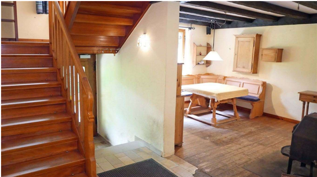
Eingangsbereich (innen) mit viel Landhauscharme