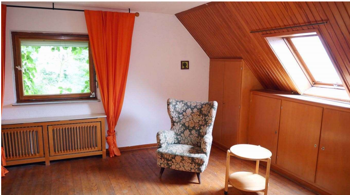
zwei besonders gemütliche Zimmer im Dachgeschoss