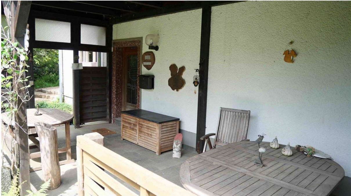
Eingangsbereich (außen) als überdachte Terrasse