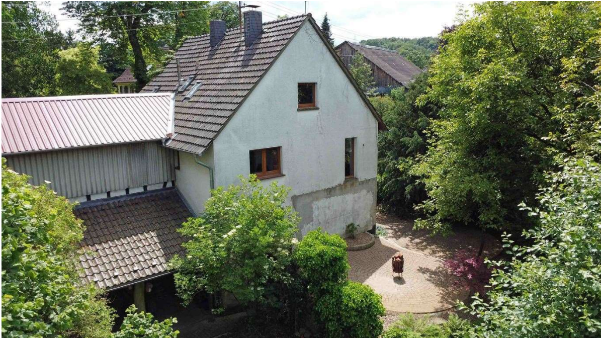
Hausrückseite mit Terrasse, Garten und...