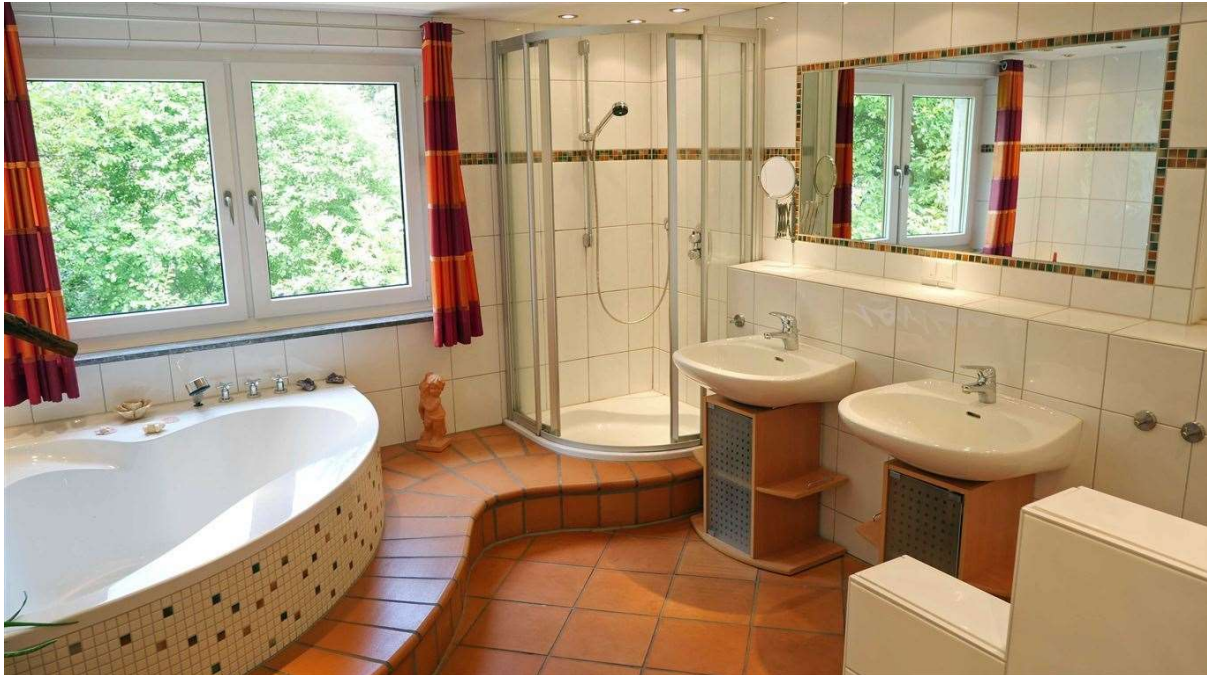
großes Bad im Obergeschoss 2010 modernisiert