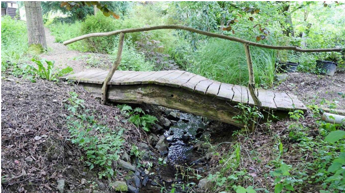
Bachlauf mit Holz-/Naturbrücke