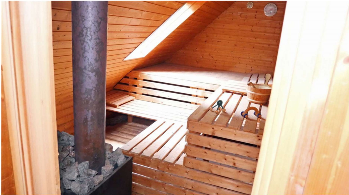
Sauna mit Holzofen