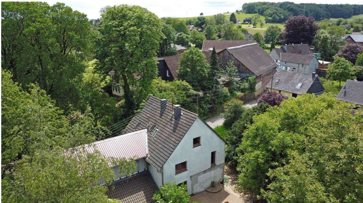
herrliche Lage in einem kleinen Dorf bei Waldbröl