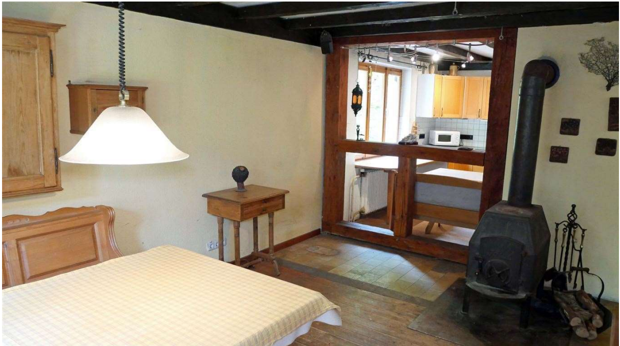
Esszimmer (16 m 2 ) mit Kamin und Blick zur...