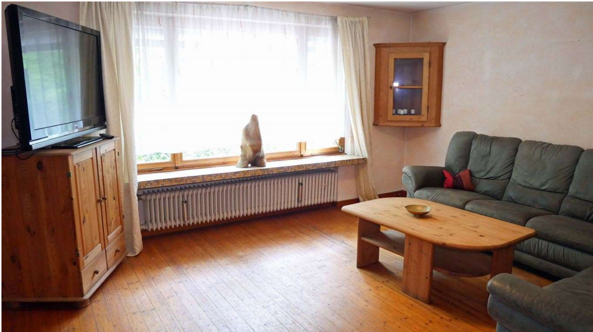
Holzdielenböden in allen 7 Zimmern