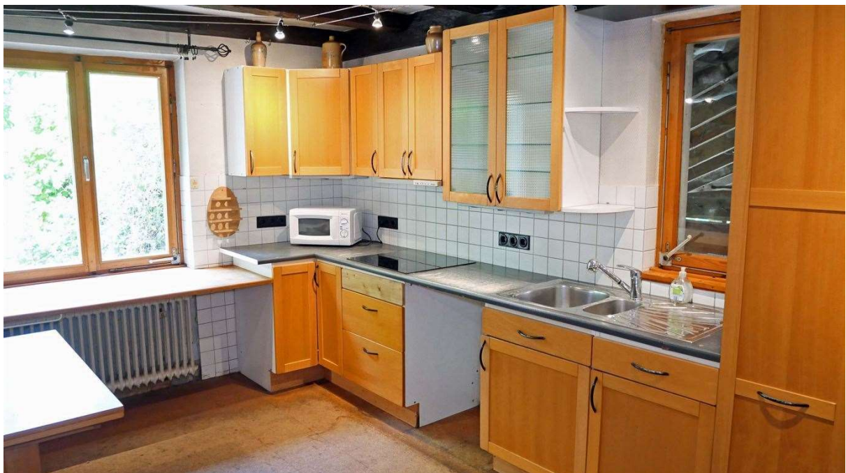
Küche mit Blick zur Terrasse und Garten