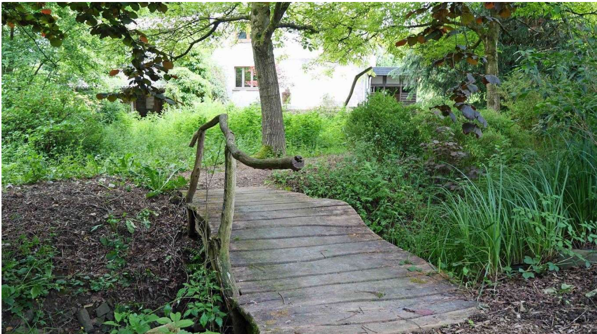
...als Naturgarten mit Bachlauf