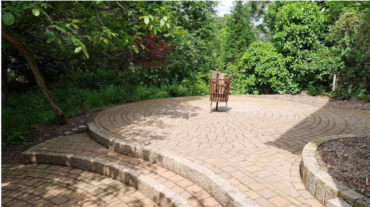
große, gepflasterte Terrasse hinter dem Haus