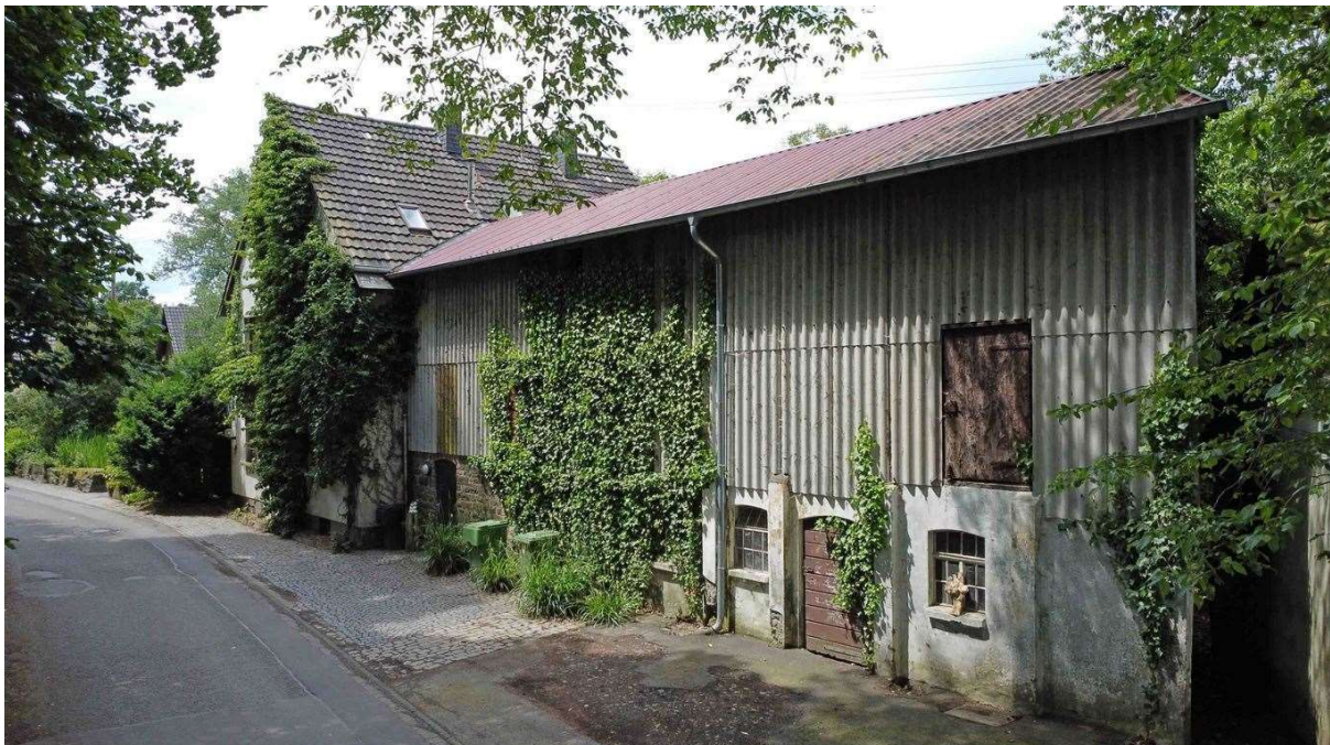
angebauter Stall mit großer Scheune darüber