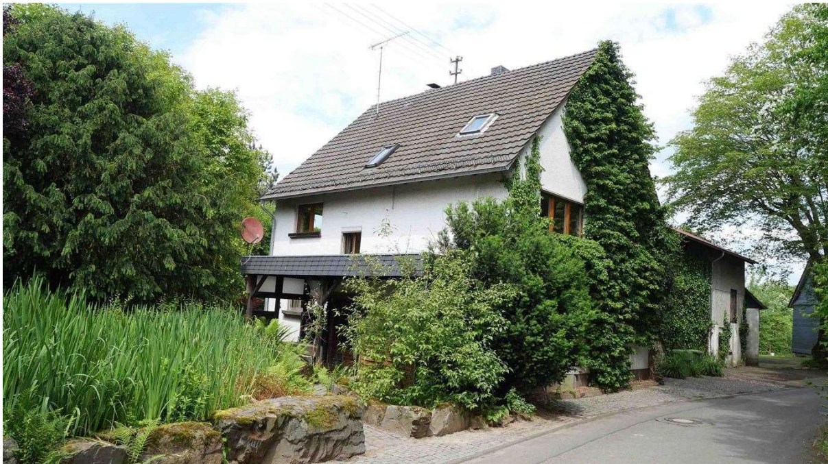
Eingangsseite mit Biotop davor und Scheune dahinter