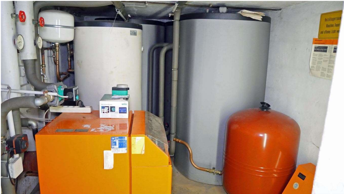
zwei Heizungen im Haus: Ölzentralheizung, Baujahr 1989/1995 und...