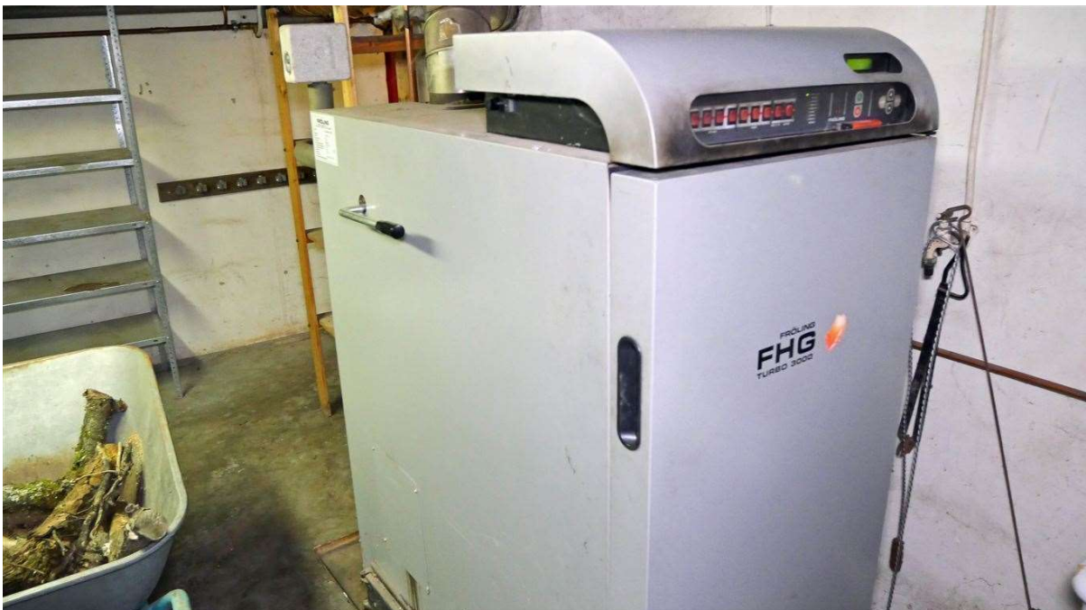
...eine moderne Holzheizung mit Vergasertechnik