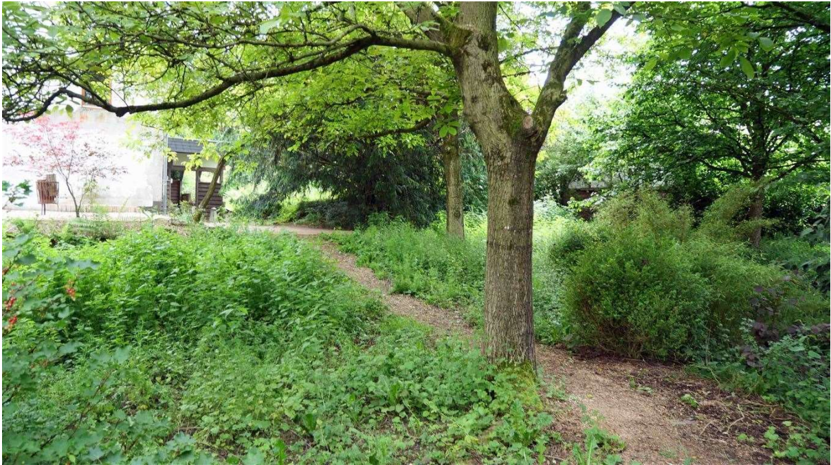
1.600 m 2 großes Grundstück...