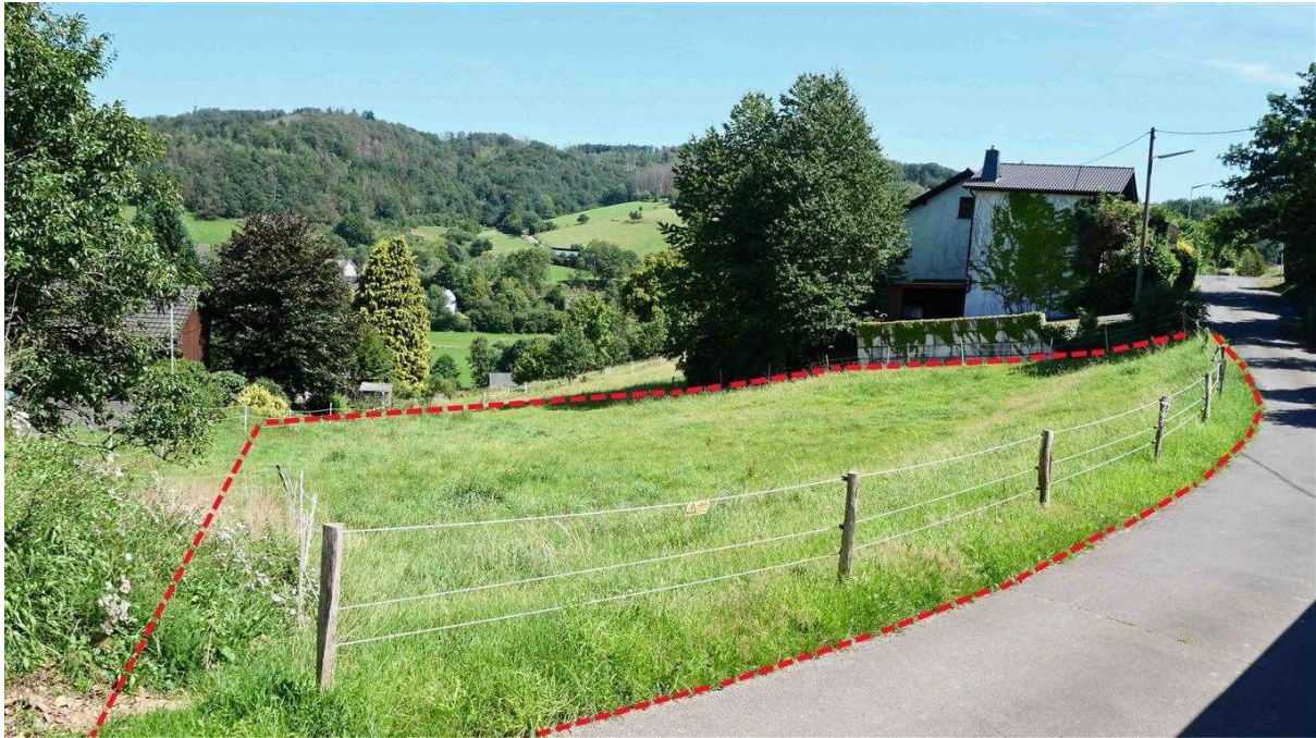
Blick von der Zufahrtseite / Kapellenweg