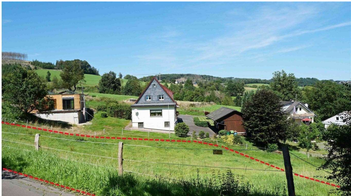
Perfekt für alle Naturliebhaber und Ruhesuchende