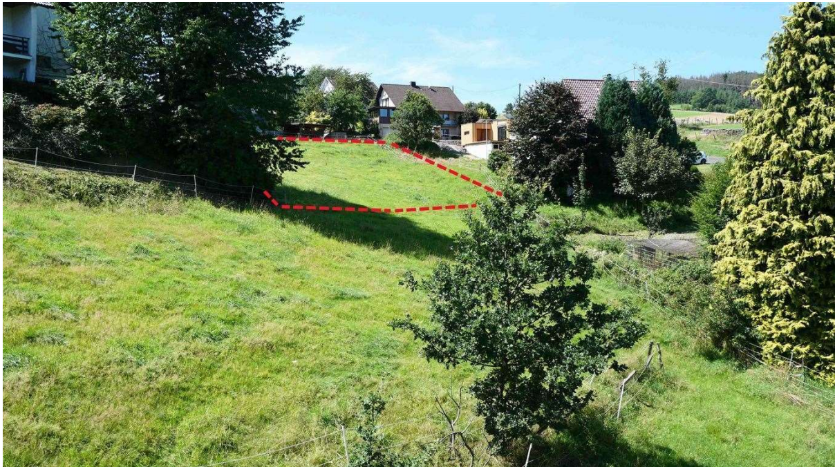
Blick von unten