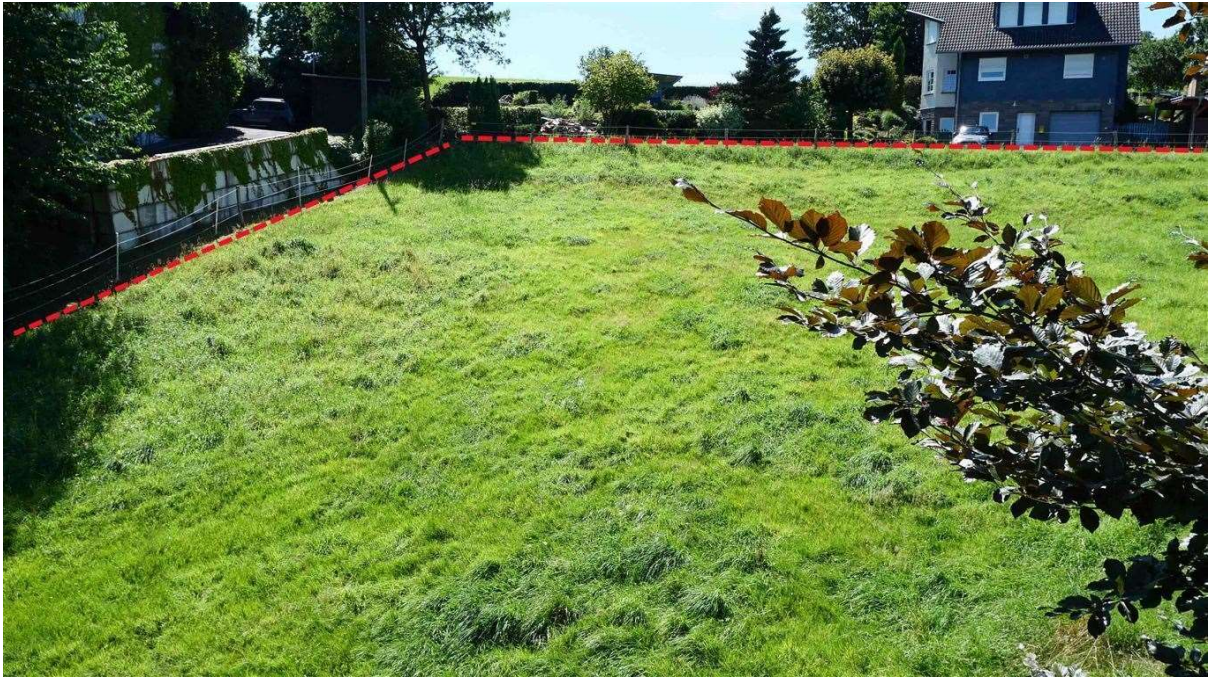
972 m 2 Bauland, zum Westen abfallend