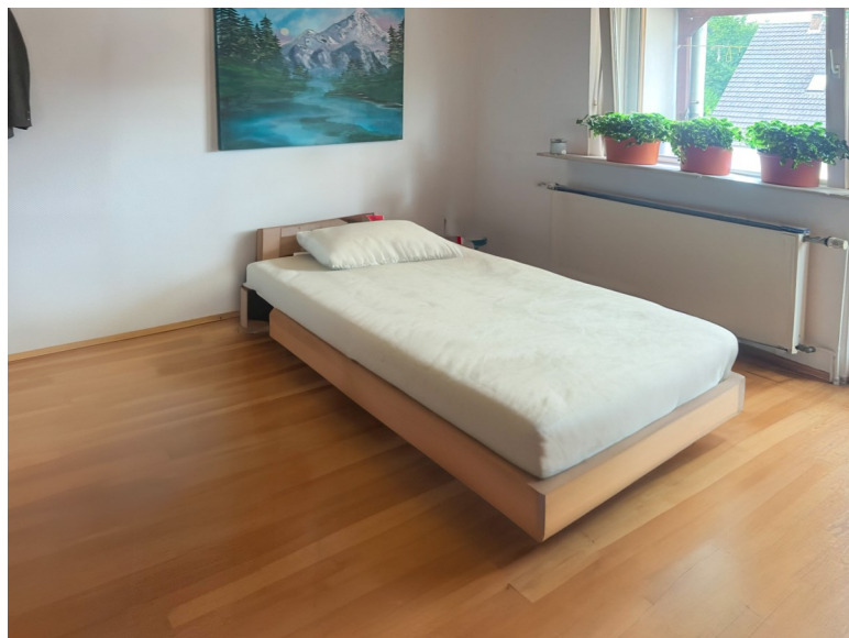
Zimmer mit Zugang zum Balkon