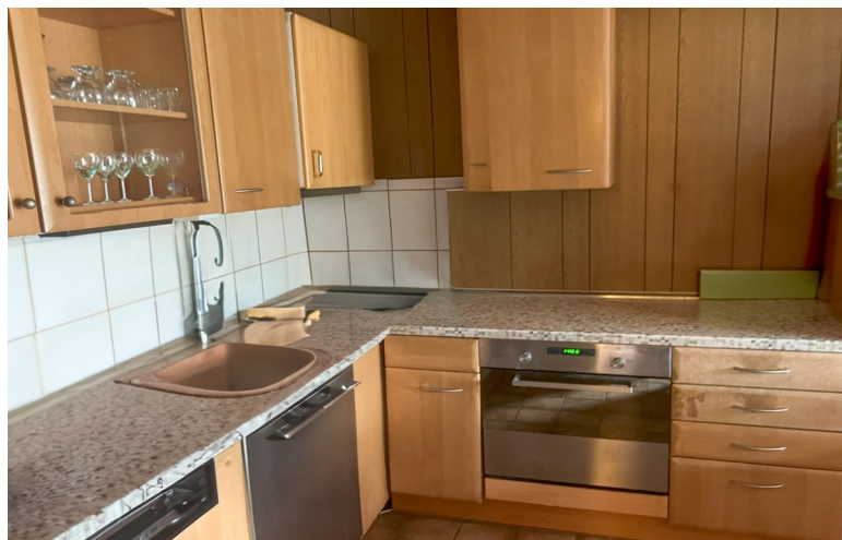
Küche mit Platz für einen Esstisch