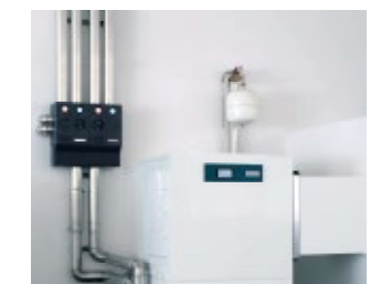
Gebäudetechnik – Ein Beitrag zum Klimaschutz/effizient und nachhaltig