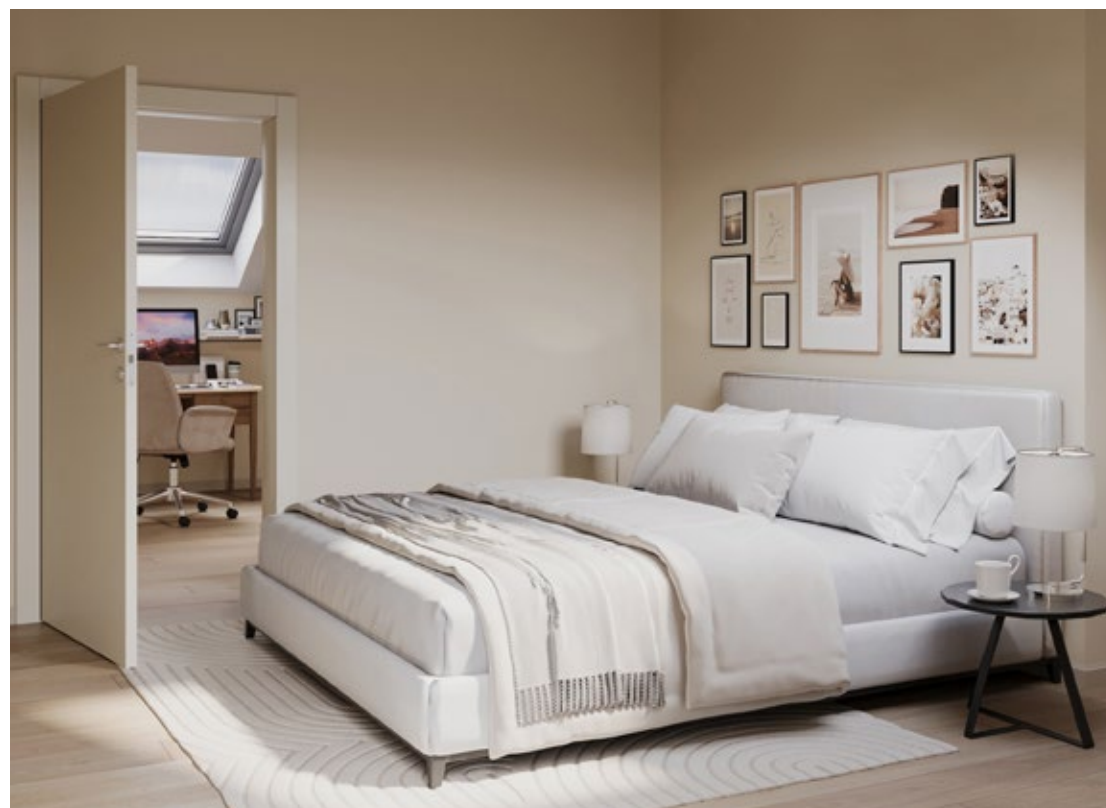
Unverbindliche Visualisierung. Darstellung kann Sonderwünsche enthalten.

Auch die Parkplatzsuche gehört der Vergangenheit an, denn auf Wunsch ist Ihnen in der Tiefgarage ein Platz sicher.