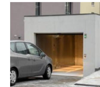
Moderner Autoaufzug der Fa. Lödige

Energie aus der Umgebungsluft - in Verbindung mit einer Luft-Wasser-Wärmepumpe und Gas-Niederbrennwerttechnik schonen wir nicht nur die Umwelt, sondern erfüllen zudem die Voraussetzungen für ein "KfW-Effizienzhaus 55" auf der Grundlage des GEG 2020.