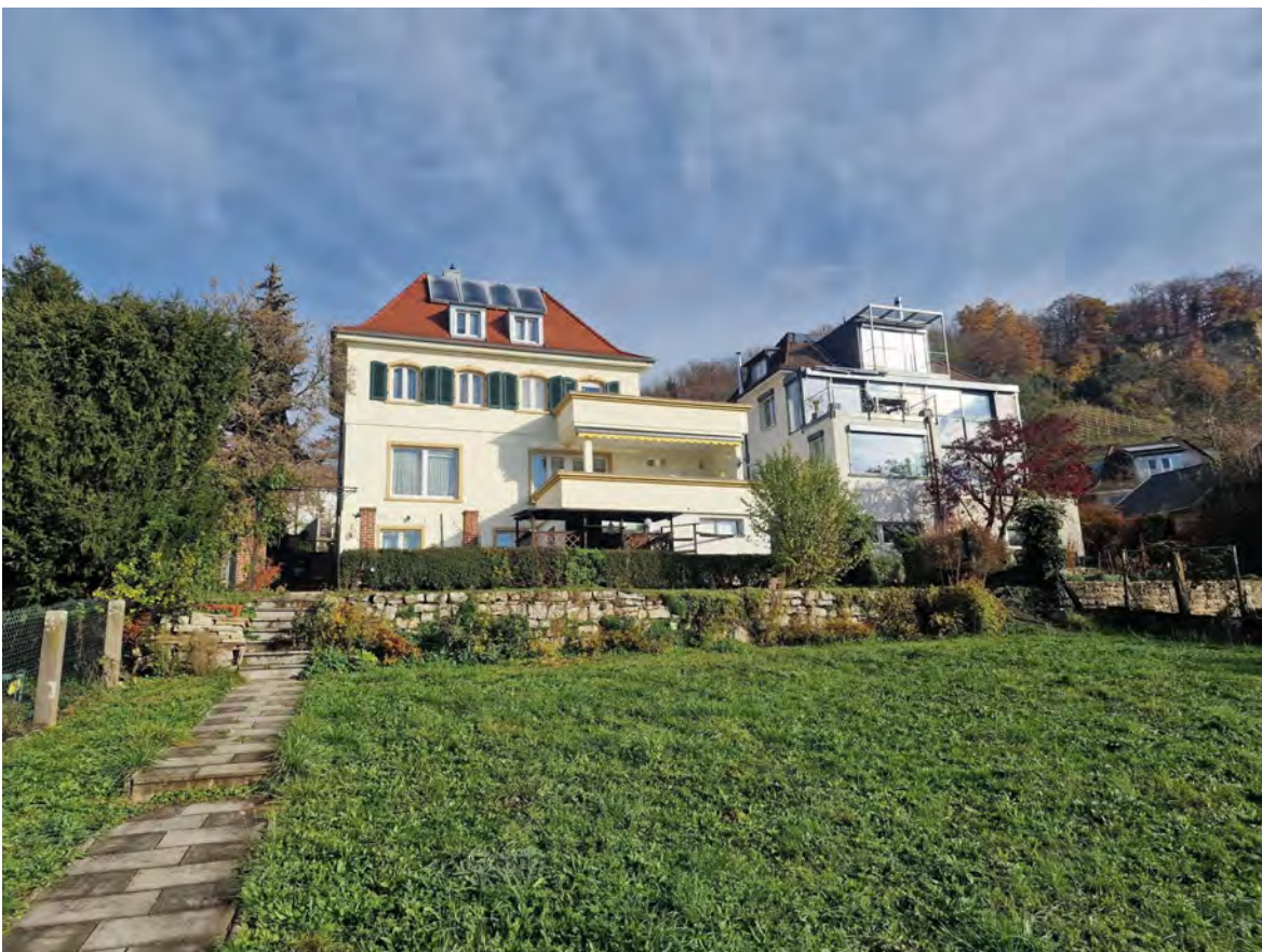
Außenansicht + Grundstück