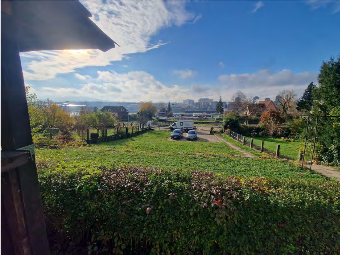
Blick vom Garten