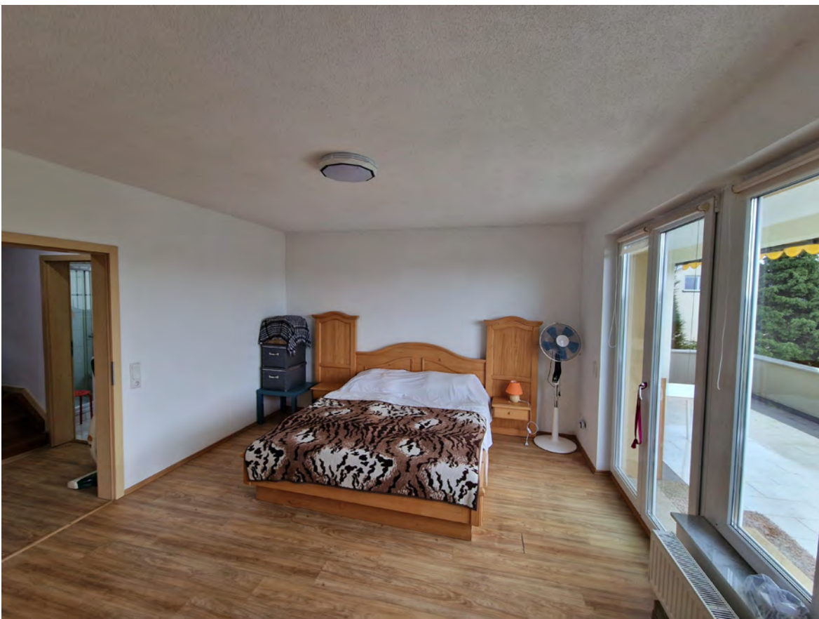
Optionales Esszimmer EG