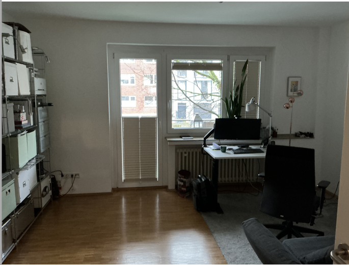
69440.54.1.2 - Kinder-/Arbeitszimmer

Zimmer: 3,0 Wohnfläche ca.: 106,78 m 2 Kaltmiete: 1.442,00 € Gesamtmiete: 1.799,00 €