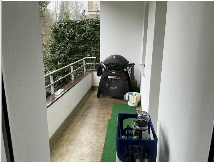
69440.54.1.2 - Balkon 1

Zimmer: 3,0 Wohnfläche ca.: 106,78 m 2 Kaltmiete: 1.442,00 € Gesamtmierte: 1.799,00 €