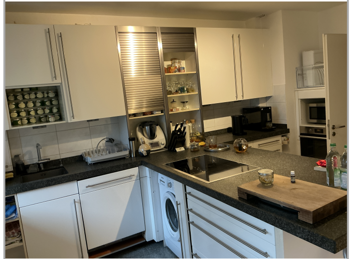
69440.54.1.2 - Küche