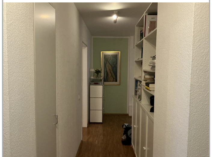
69440.54.1.2 - Diele