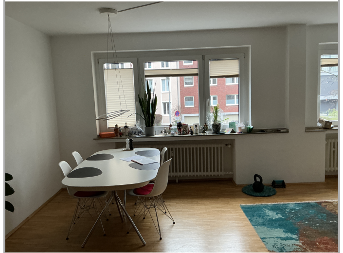
69440.54.1.2 - Wohnzimmer