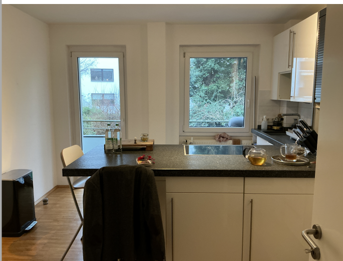
69440.54.1.2 - Küche