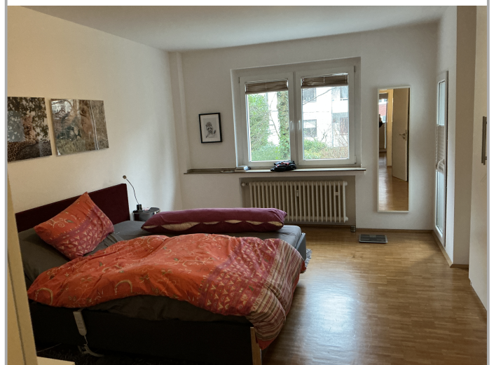
69440.54.1.2 - Schlafzimmer