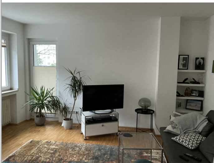
69440.54.1.2 - Wohnzimmer