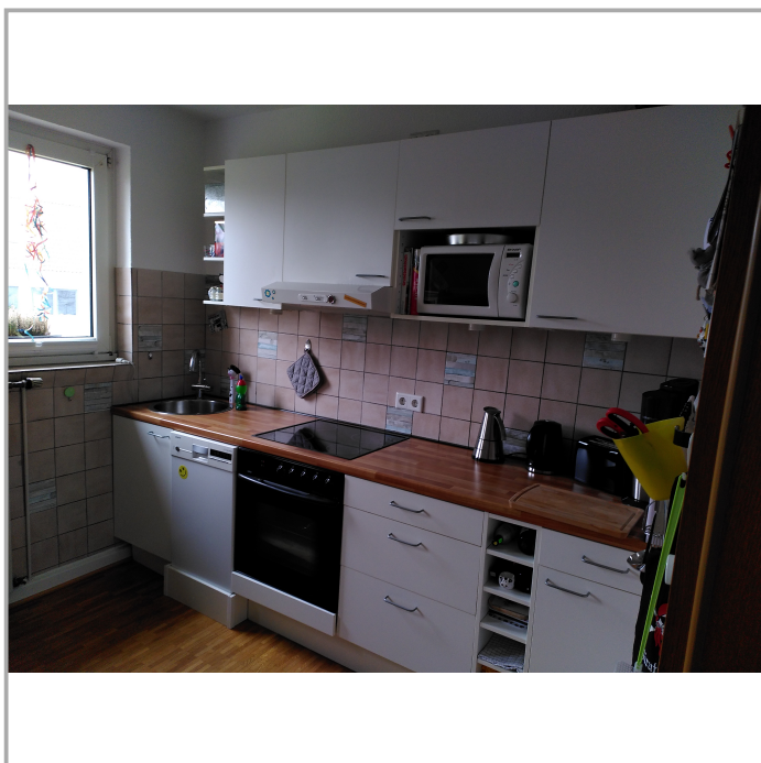
69440.23.1.3 - Küche

Zimmer: 3,0 Wohnfläche ca.: 63,91 m 2 Kaltmiete: 671,00 € Gesamtmierte: 790,00 €