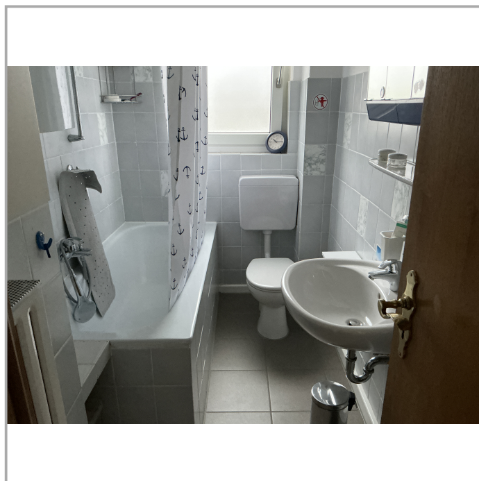
69440.23.1.3 - Badezimmer