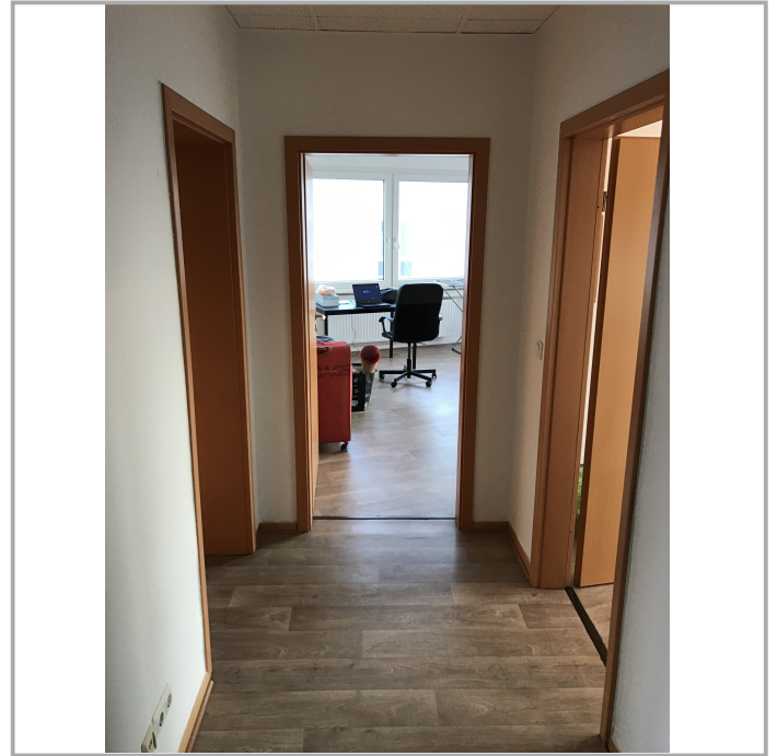
69440.144.1.2 - Diele