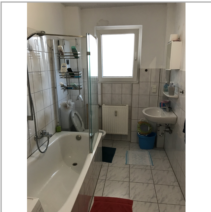
69440.144.1.2 - Bad