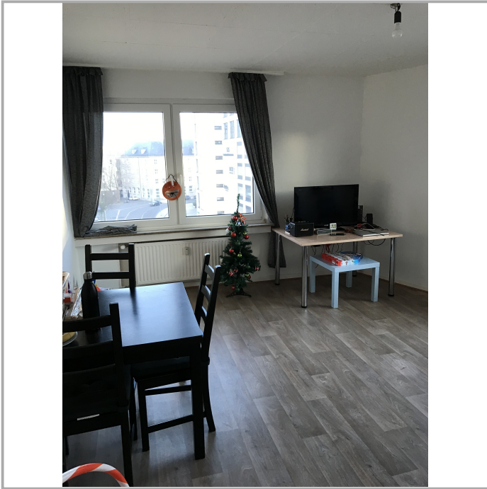
69440.144.1.2 - Kinderzimmer

Zimmer: 3,0 Wohnfläche ca.: 84,60 m 2 Kaltmiete: 550,00 € Gesamtmierte: 828,00 €