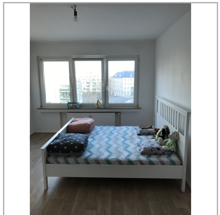
69440.144.1.2 - Schlafzimmer