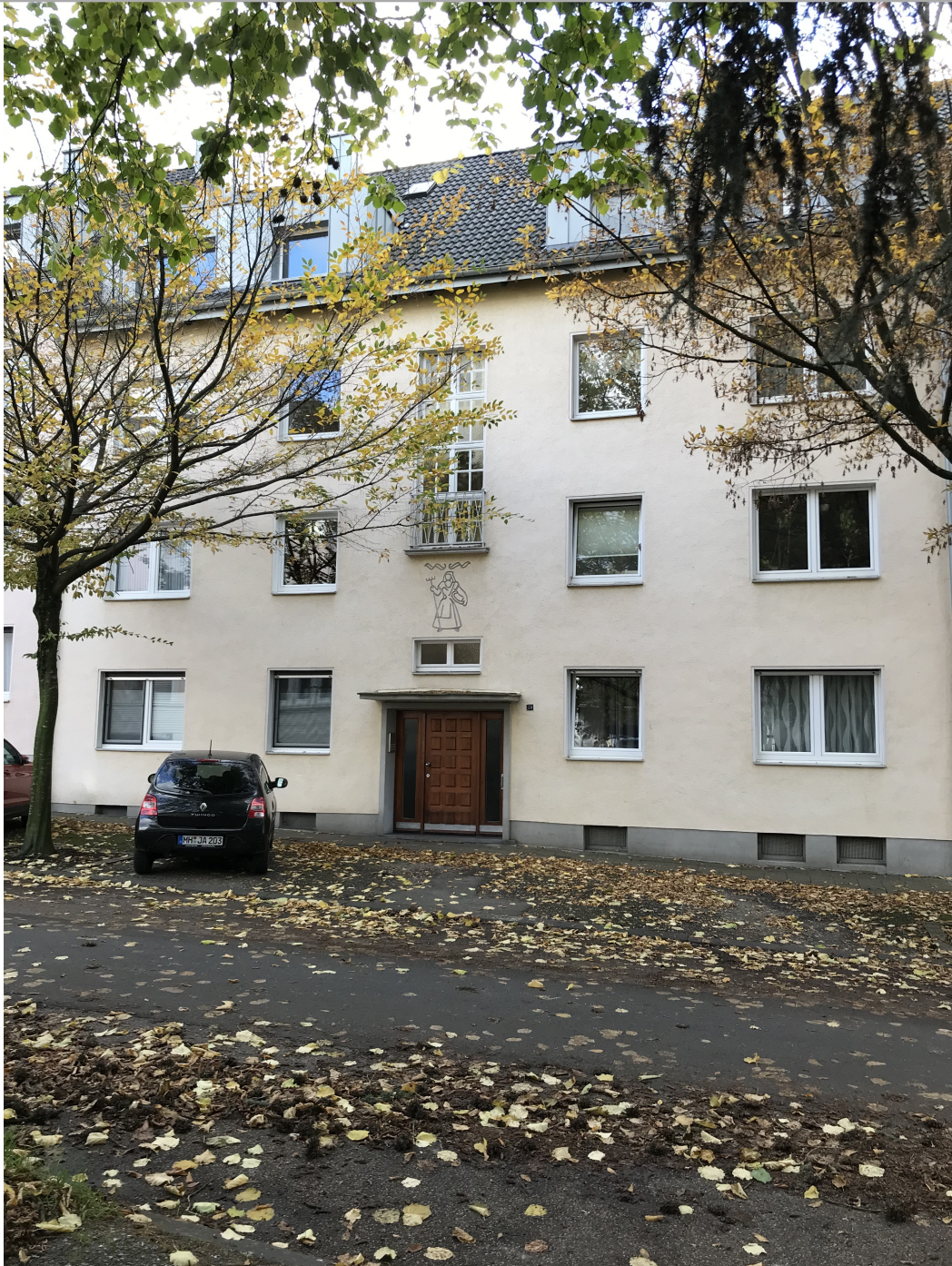
69440.144.1.2 - Außenfassade

Zimmer: 3,0 Wohnfläche ca.: 84,60 m 2 Kaltmiete: 550,00 € Gesamtmierte: 828,00 €