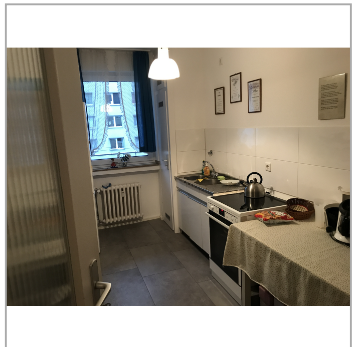
69440.74.1.4 - Küche