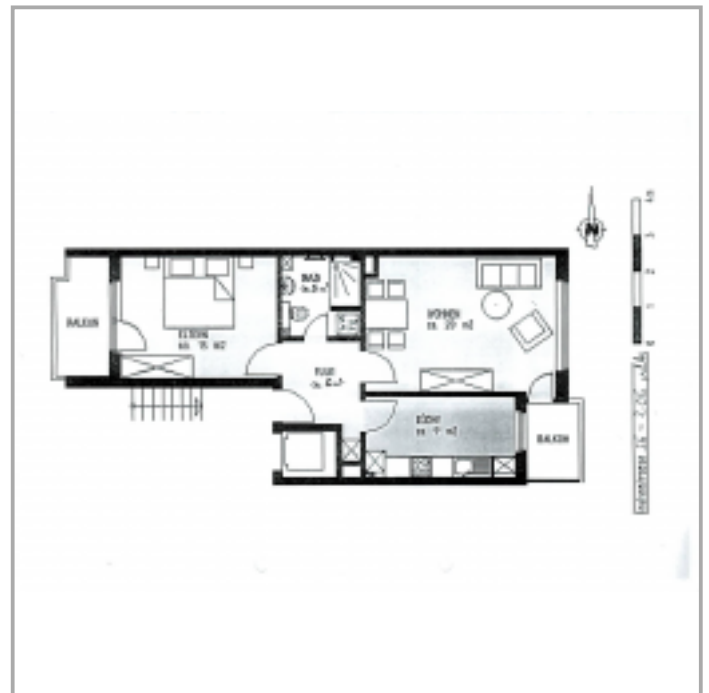
69440.74.1.4 - Grundriss

Düsseltal liegt am nordöstlichen Innenstadtring und ist heute noch in der gängigen Bezeichnung "Zooviertel" gegenwärtig und als grüne Oase von Düsseldorf bekannt. Trotzdem ist der Stadtteil zentrumsnah und das öffentliche Nahverkehrsverbindingssystem in Düsselstal ist sehr gut. In Düsselstal wird sich wohlfühlen, wer Wohnqualität, Zentrumsnähe, Grünoasen sowie Abwechslung schätzt.