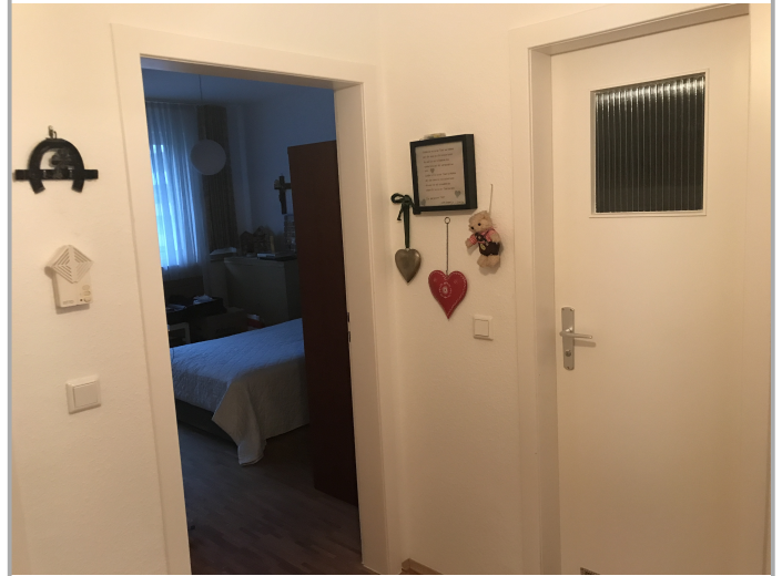
69440.74.1.4 - Diele