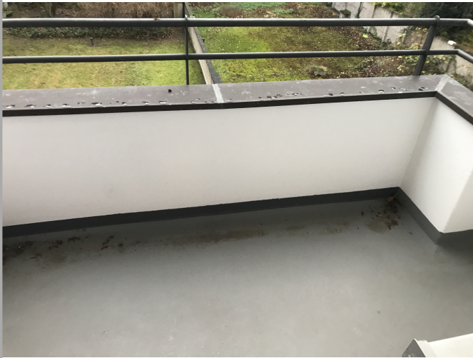
69440.74.1.4 - Balkon

Zimmer: 2,0 Wohnfläche ca.: 57,02 m 2 Kaltmiete: 684,00 € Gesamtmieta: 885,00 €