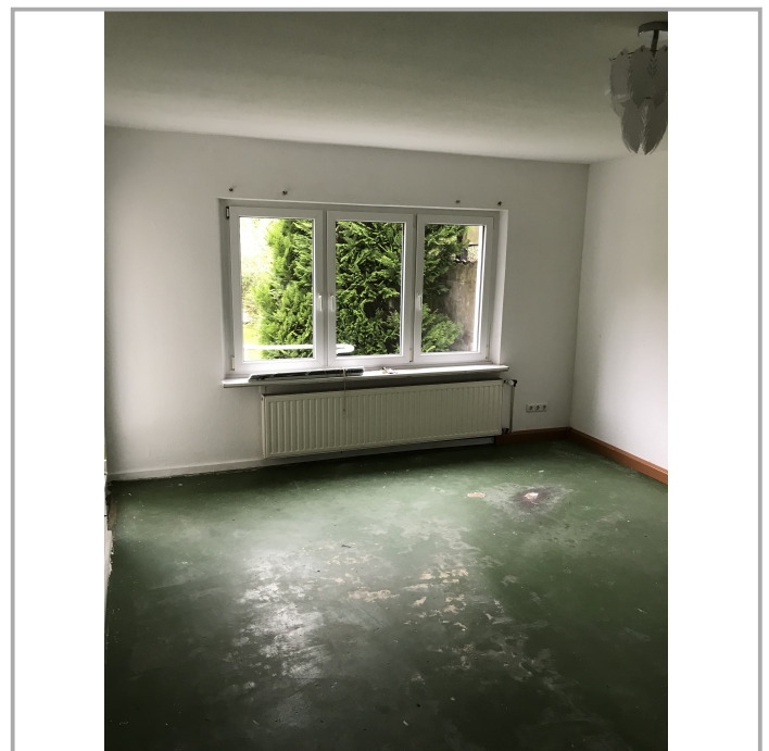
69440.147.1.2 - Wohnzimmer