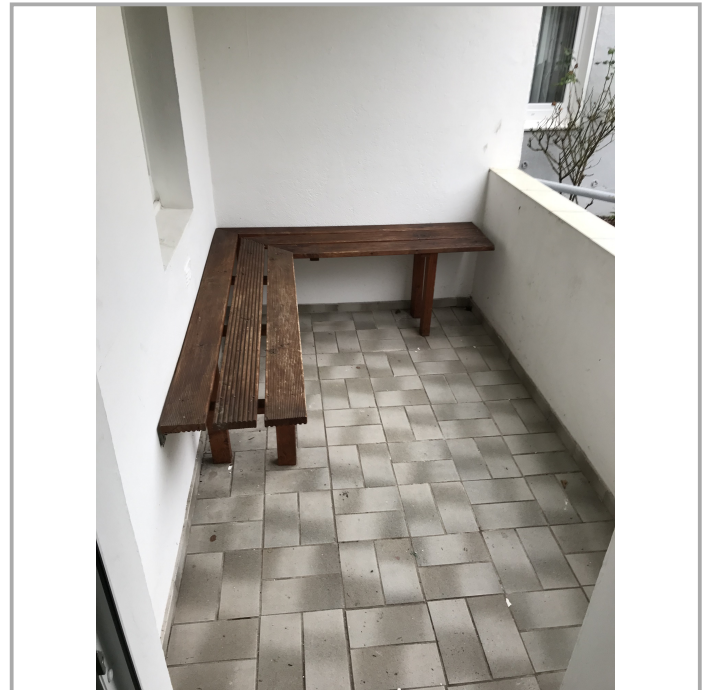
69440.147.1.2 - Balkon

Dieses Objekt befindet sich in einer zentralen und sehr nachgefragten Wohnlage. Der Kluse Park und die Freilichtbühne liegen in direkter Nachbarschaft und auch das Forum und der Hauptbahnhof sind fußläufig erreichbar.