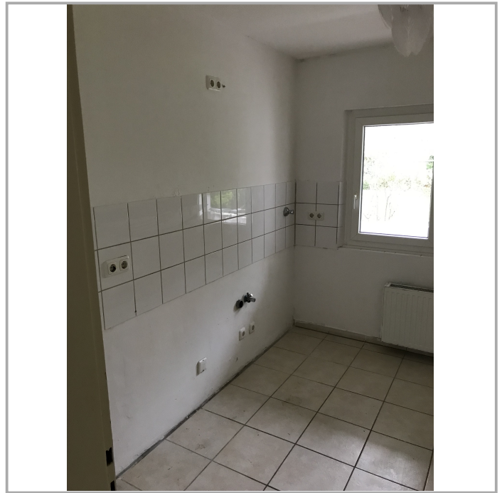
69440.147.1.2 - Küche