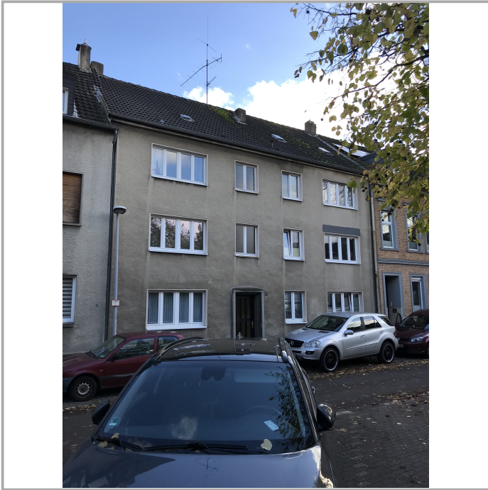
69440.147.1.2 - Außenfassade