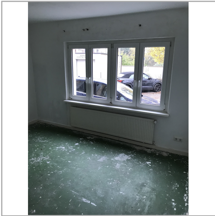
69440.147.1.2 - Schlafzimmer

Zimmer: 2,0 Wohnfläche ca.: 58,00 m 2 Kaltmiete: 399,00 € Gesamtmieta: 591,00 €