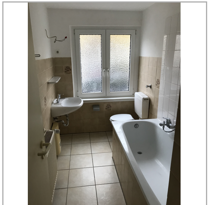
69440.147.1.2 - Bad