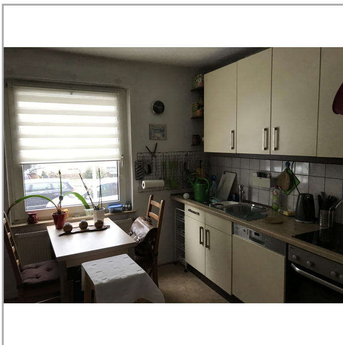
69440.1.2.6 - Küche

Zimmer: 3,0 Wohnfläche ca.: 66,91 m 2 Kaltmiete: 502,00 € Gesamtmiete: 628,00 €