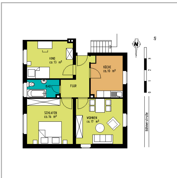
69440.1.2.6 - Grundriss