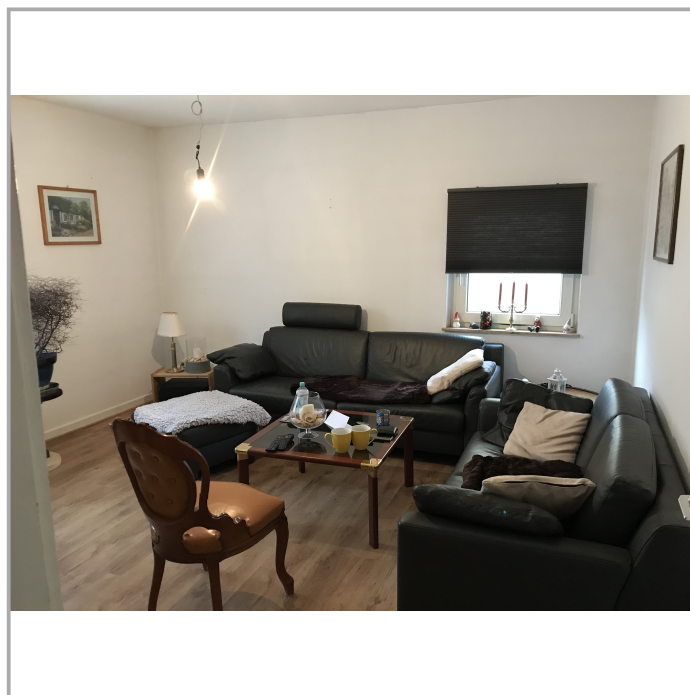
69440.1.2.6 - Wohnzimmer