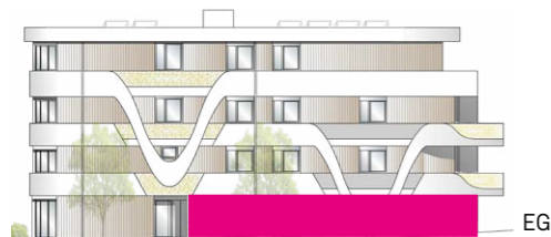
Haus E - Ansicht Nord