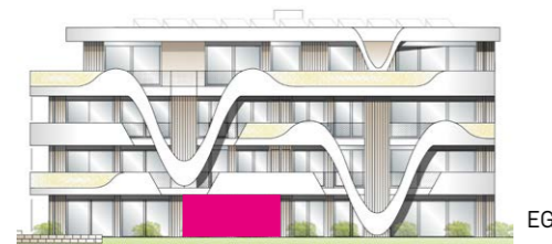
Haus F - Ansicht Süd