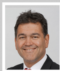
Ferdinand Ernst Immobilienberater 09181/210-657