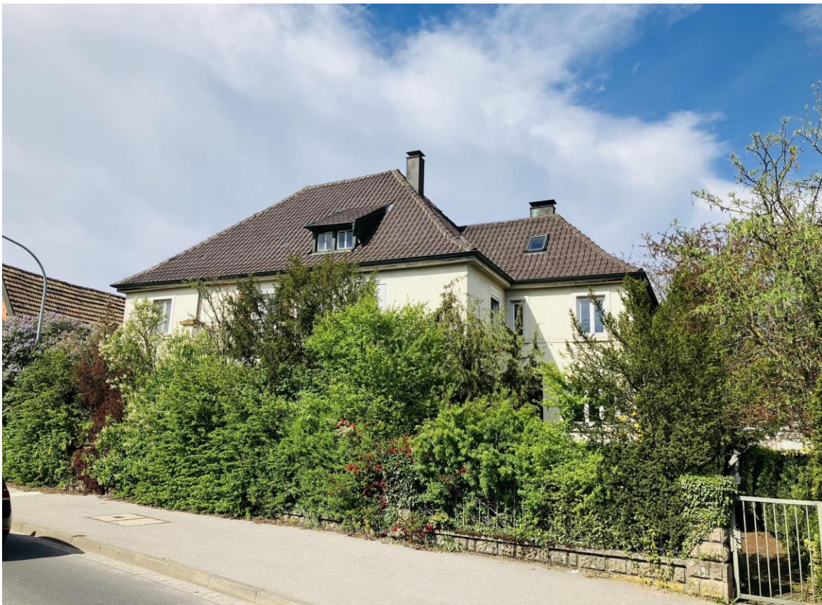
Abriss des Bestandsgebäudes an der Zeiler Straße