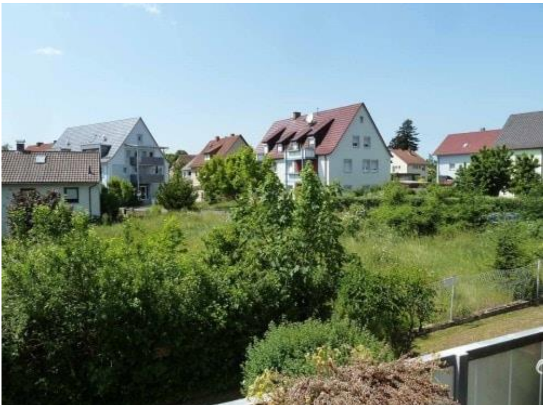
Blick auf das Baugrundstück... Wohnen in ruhiger, grüner Lage