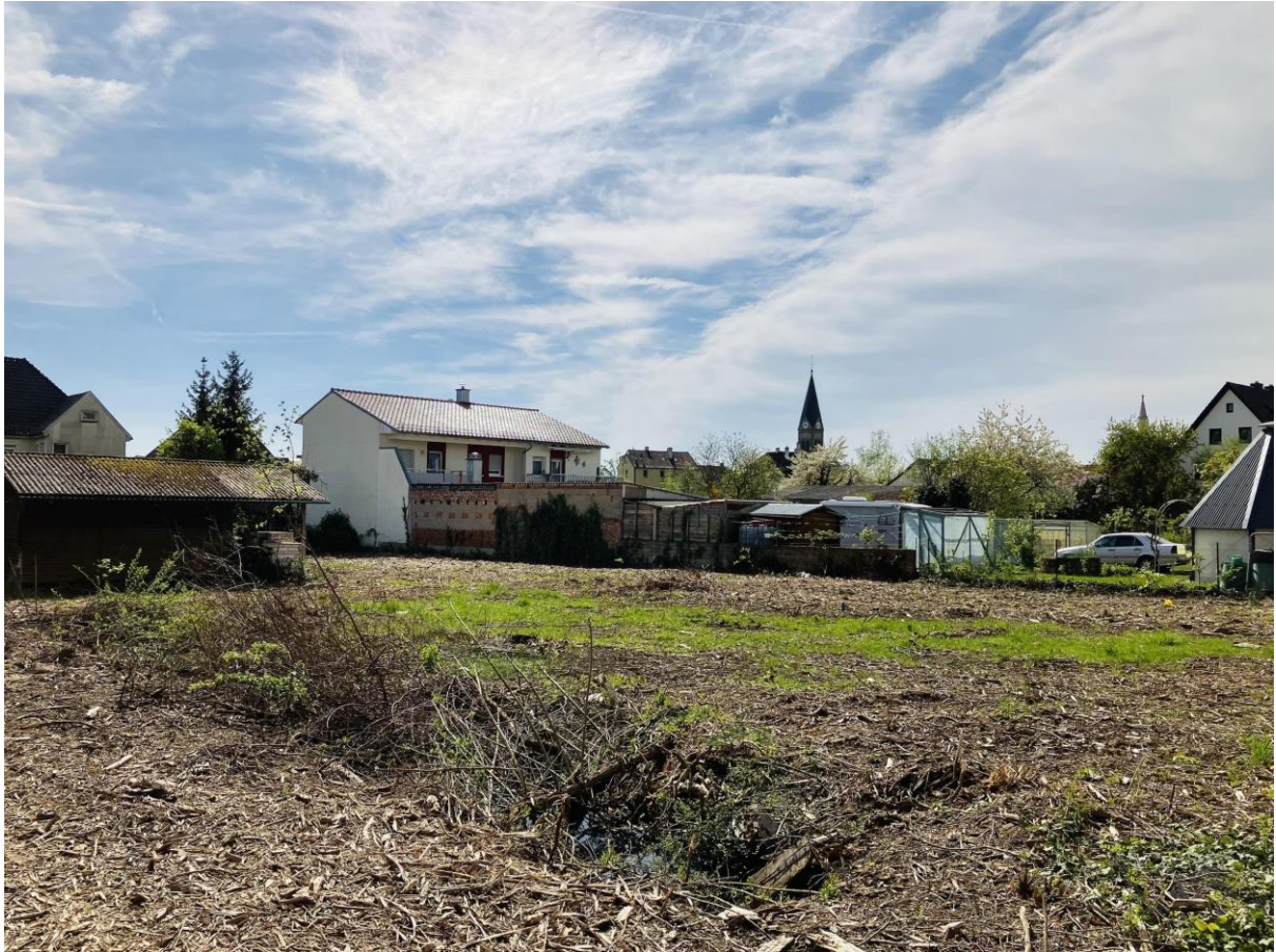
Schöner Blick in Richtung Stadtzentrum mit Kirche