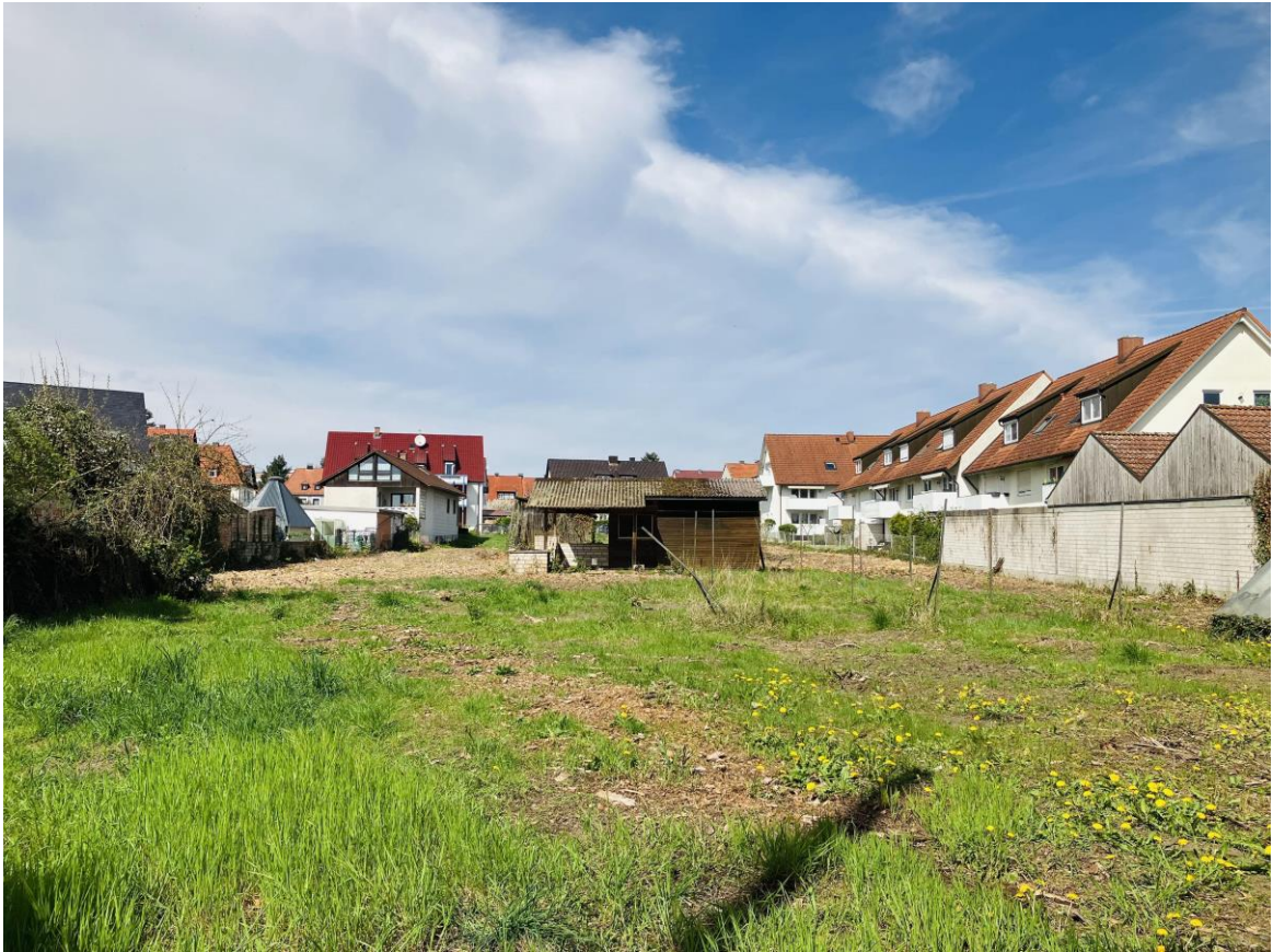
Sonnig gelegenes, ebenes Grundstück