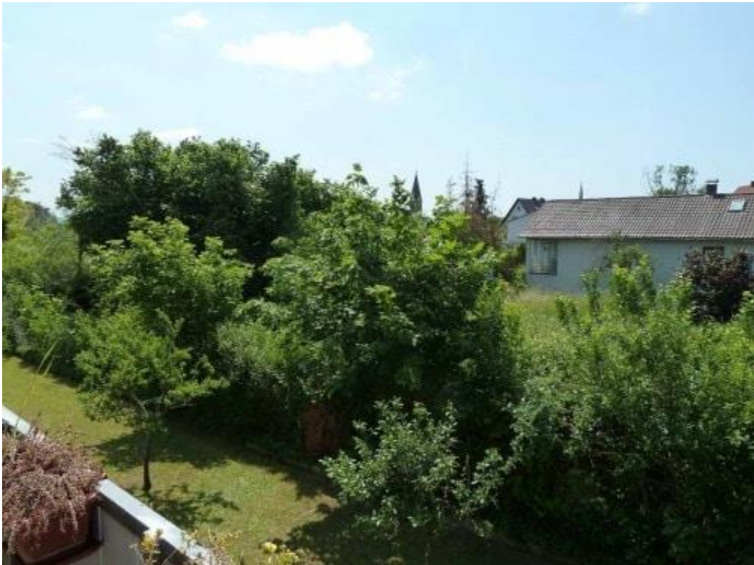
Blick auf das Baugrundstück... Wohnen in begehrter Lage