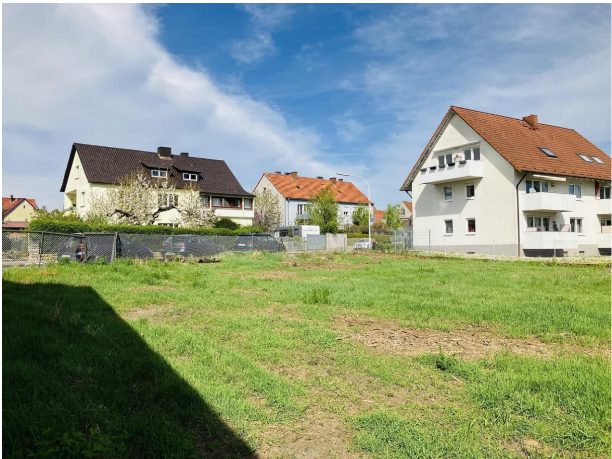
Umfeldblick nach Nordosten