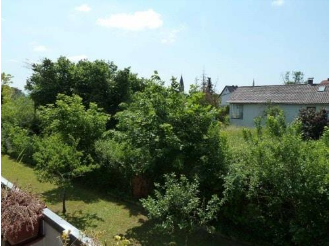
Blick auf das Baugrundstück... Wohnen in begehrter Lage