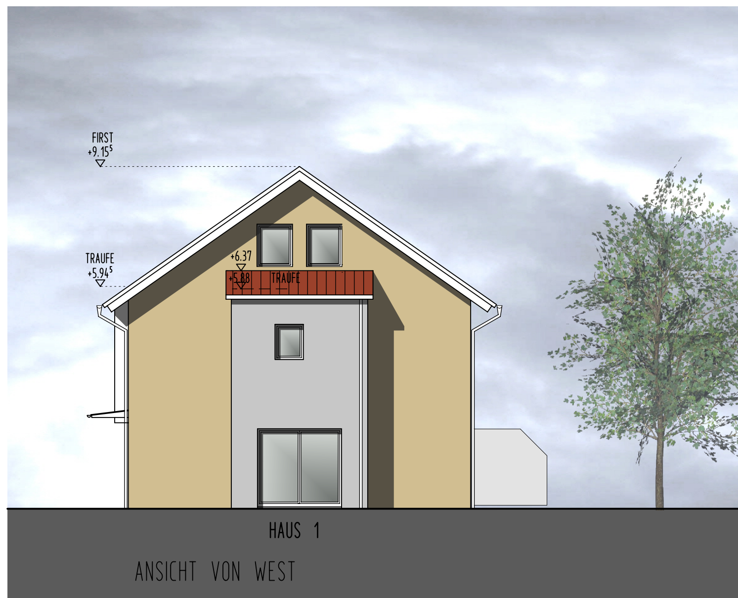
ANSICHT VON WEST