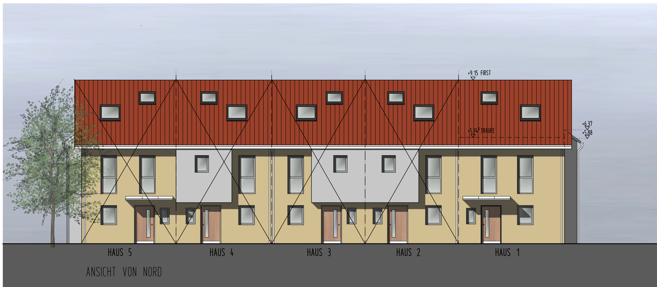
ANSICHT VON NORD