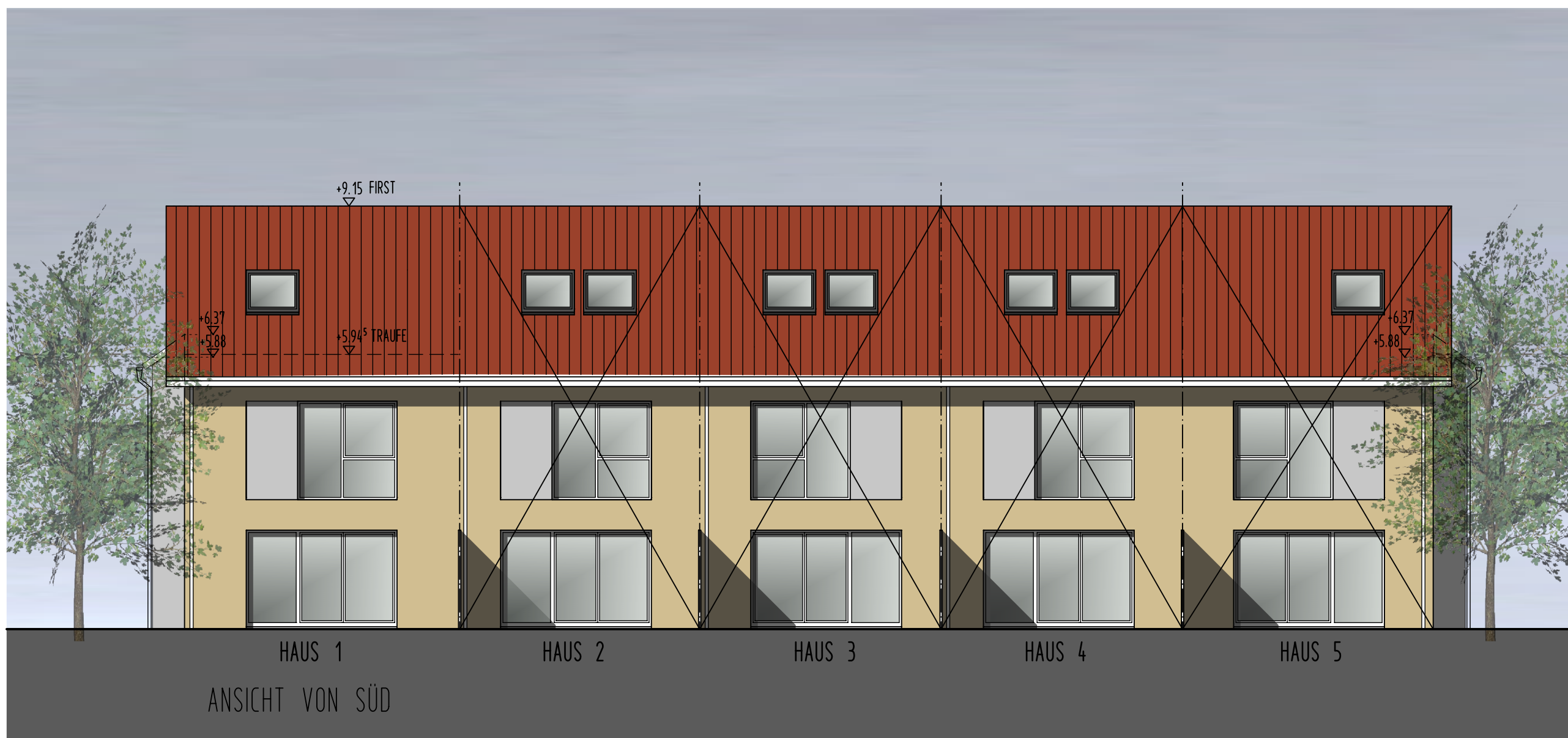
ANSICHT VON SÜD