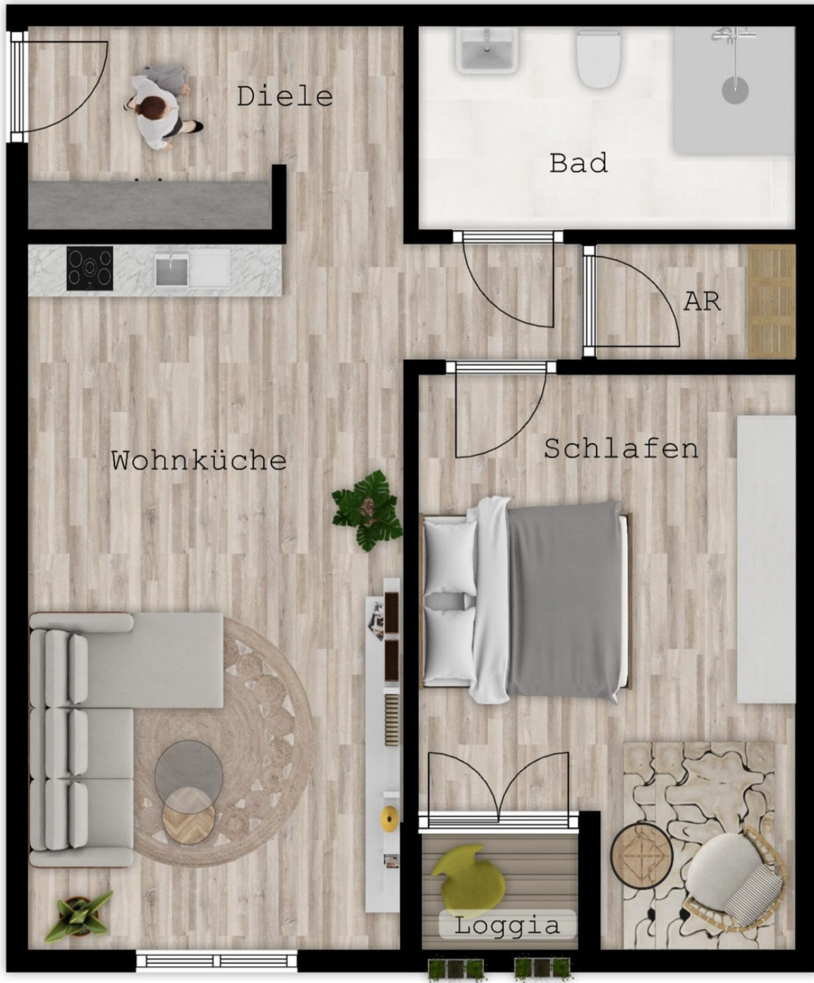
EG Whg. 04