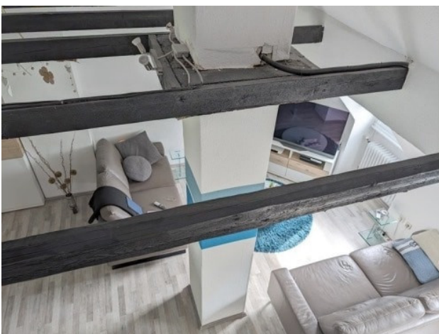
Blick von oben