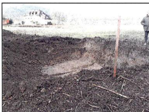
Abb. 5: Ausgekofferte Fläche, BR Westen