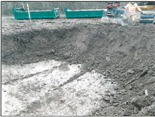
Abb. 7: Ausgekofferte Fläche, BR Osten