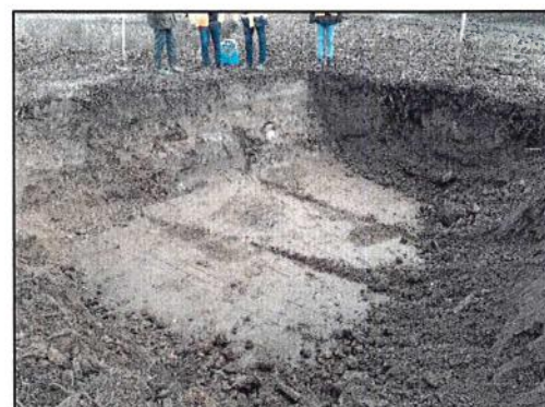
Abb. 6: Ausgekoffertes Bereich, BR Norden