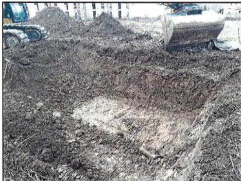
Abb. 3: Aushub Auffüllung, BR Süden