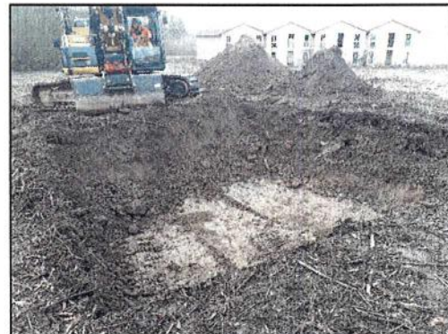
Abb. 4: Aushub Auffüllung, BR Süden