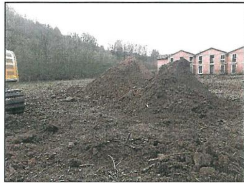
Abb. 8: Oberboden rechts, Auffüllung links