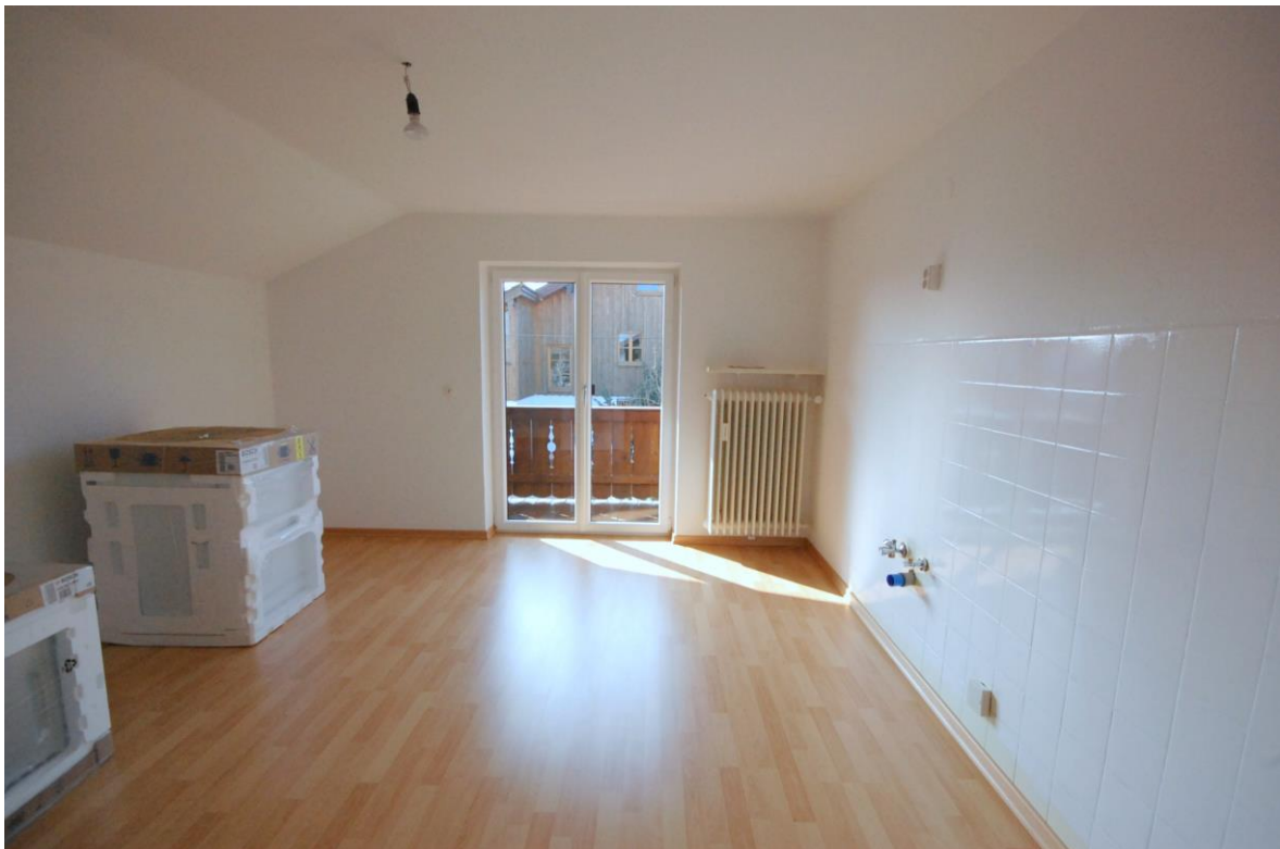
Küche Bild 1