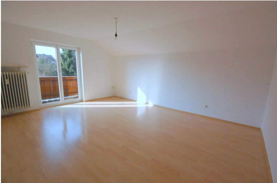
Wohnzimmer Bild 1