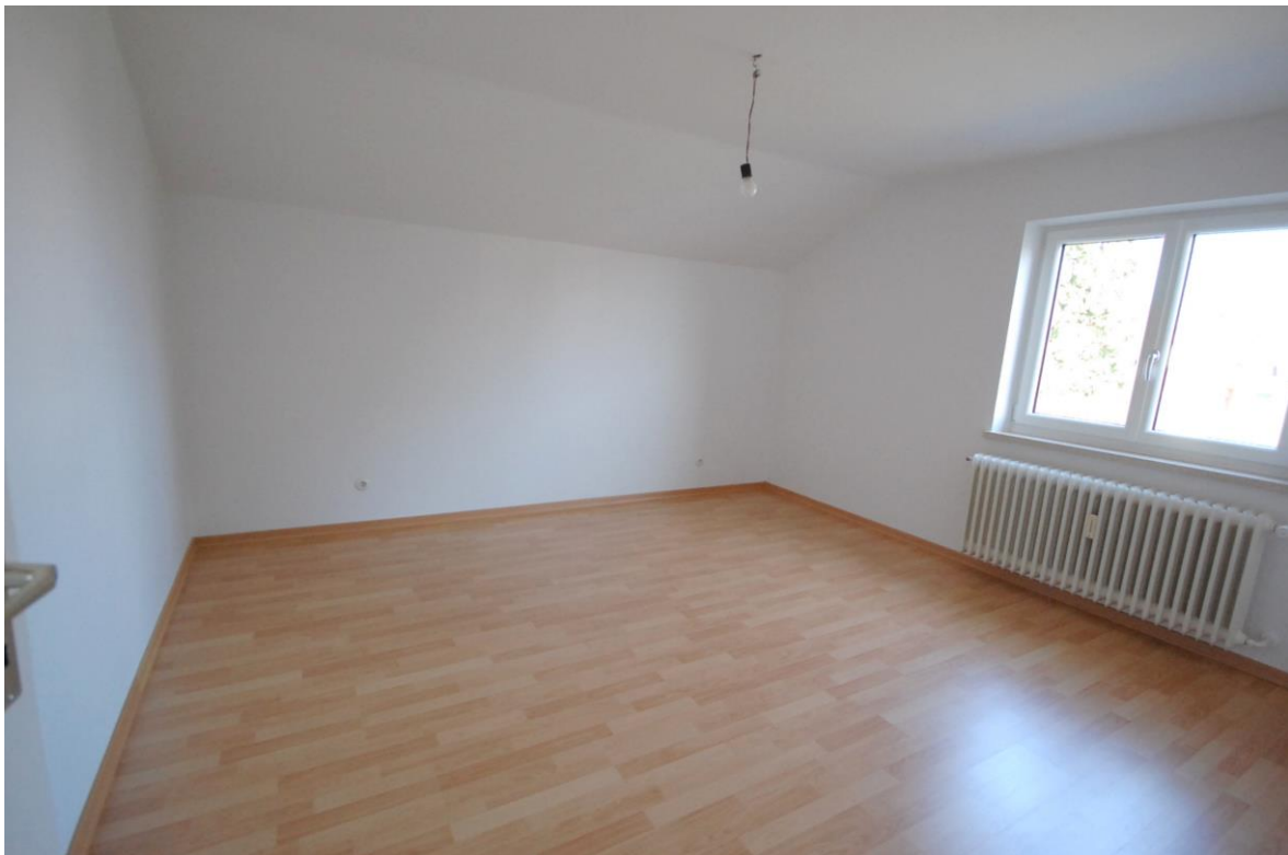
Schlafzimmer Bild 1