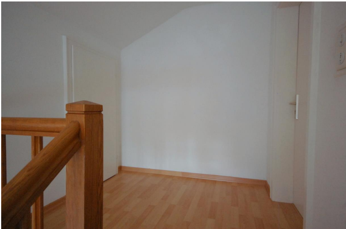
Vorflur zur Wohnung