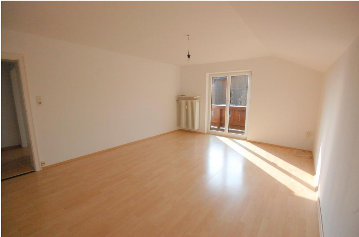
Wohnzimmer Bild 3