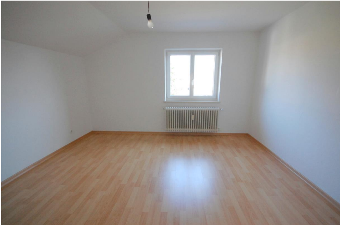
Schlafzimmer Bild 2