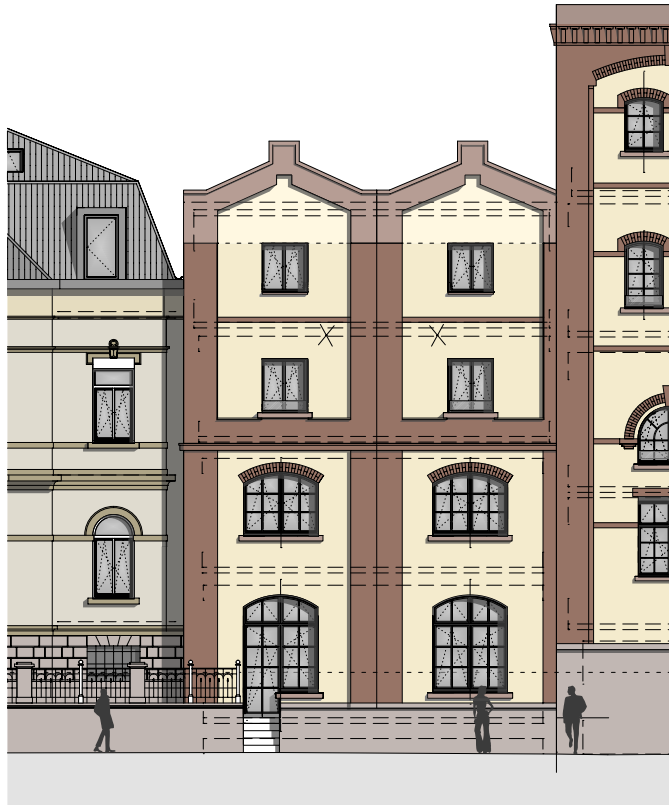
ANSICHT RÖNTGENSTRASSE M: 1:200

KONTAKT: ALTE BRAUEREI MA Kirsten Kunkel Käfertaler Str. 162 / Röntgenstr. 7 68167 Mannheim t: 0621 / 7980850 m: kunkel.immo@gmx.de